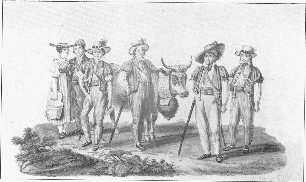
Pl. XIV. Groupe d'armaillis, vers 1830. (Aquarelle de D.-A. Schmidt, de Schwyz. Musée cantonal.)