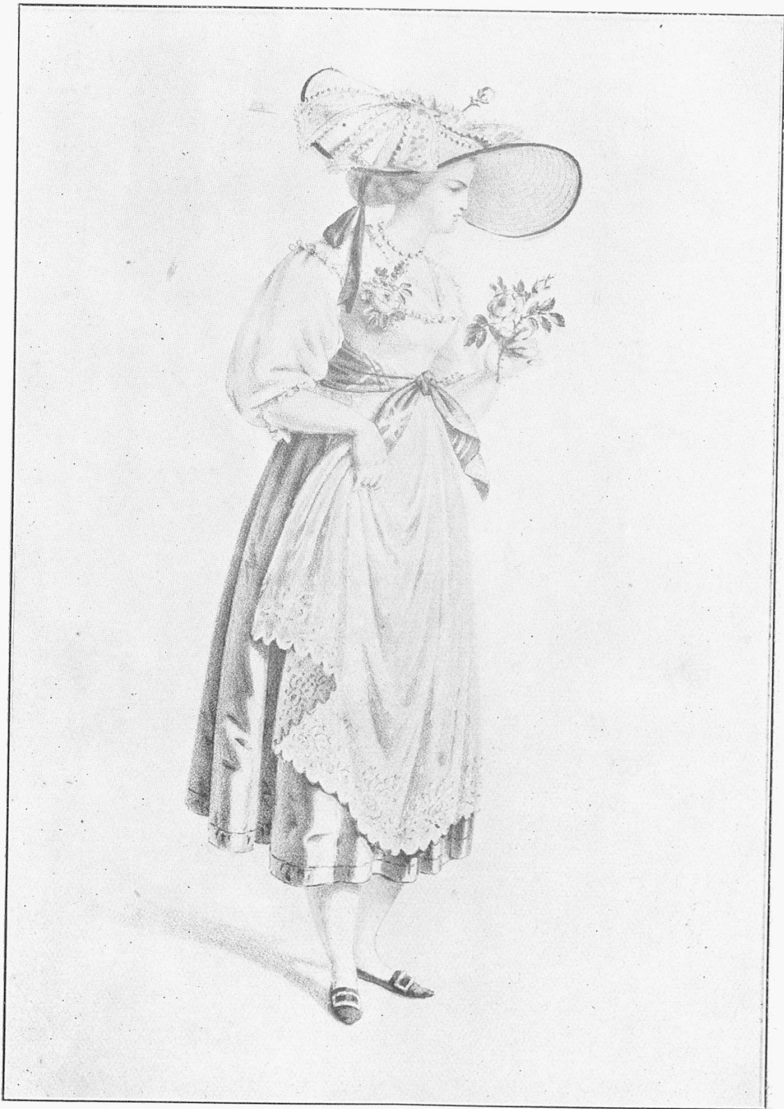
Pl. XIII. Paysanne de Belfaux, en costume national, vers 1830. (Lith. de F. N. König. Musée cantonal.)