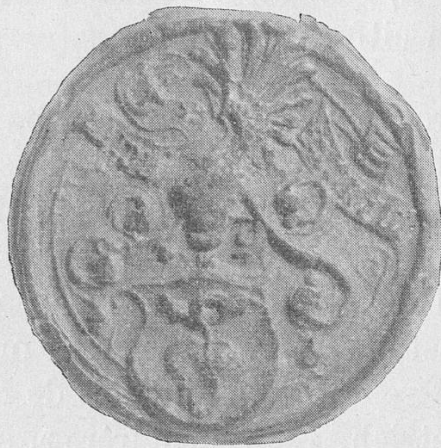
Sceau d'Antoine I Krummenstoll

L'on trouve ici la clef de l'énigmatique « apostasie ». Renonçant à ses dignités, Messire Antoine se fit radier du Chapitre de St-Nicolas en même temps que du Chapitre de St-Pierre, au scandale 2 de ses confrères savoyards. Apparemment, ceux-ci ignorèrent les causes de cette conversion à rebours ; nous ne sommes guère