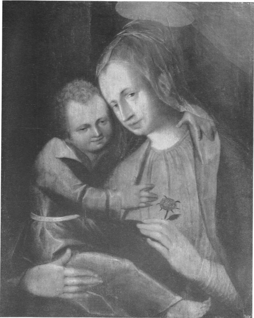
Pierre Vuilleret: La Madone à la rose, 1609.