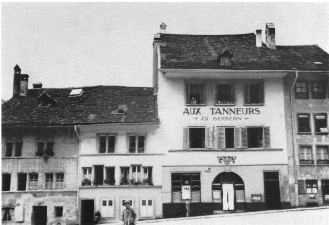
La maison de Pierre Wulleret, Place du Petit-Saint-Jean, n° 41.