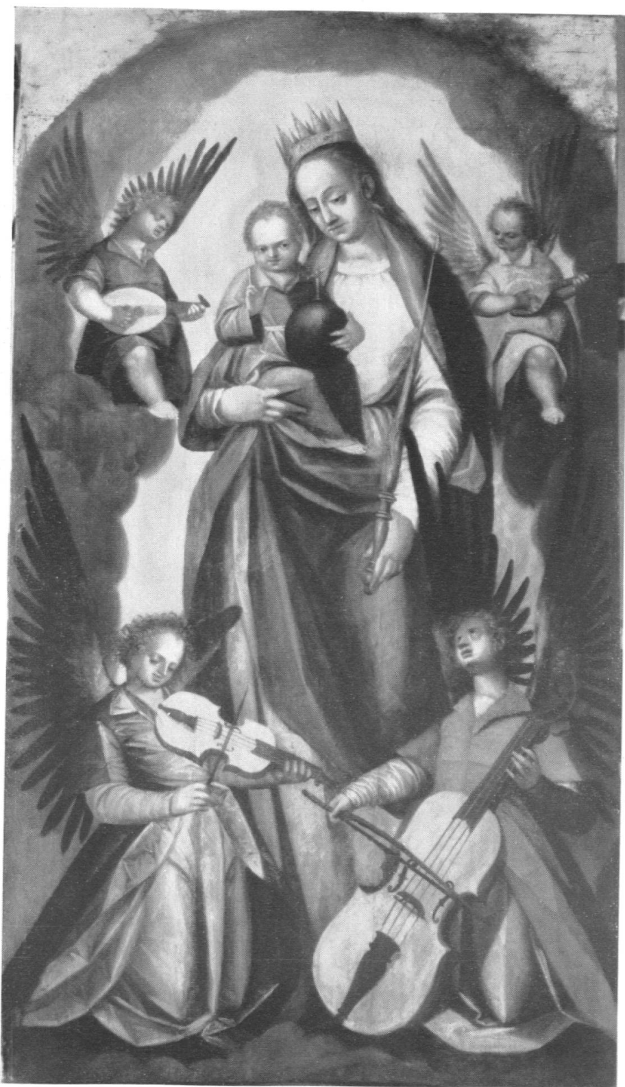
Pierre Vuilleret: La Madone aux anges musiciens, 1610, de l'un des autels de la Maigrauge.