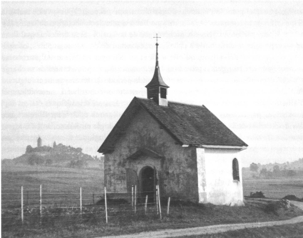
Paysage d'avant l'industrialisation: la colline de Romont derrière la chapelle Sainte-Anne d'Aruffens.