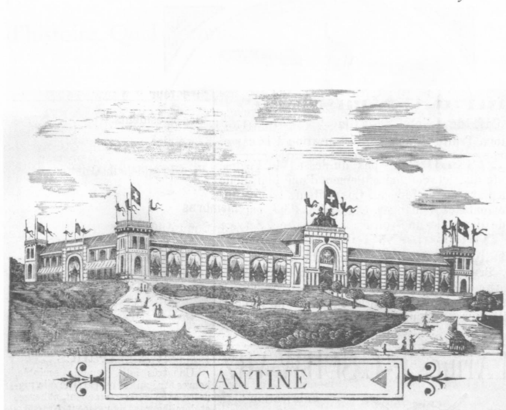
Gravure tirée du journal de fête.