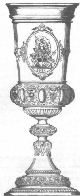
Gravure tirée du journal de fête.

On engagea pour l'ensemble des prix un montant de 26 443 francs. Visible du stand de tir, le pavillon des prix formait un curieux octogone