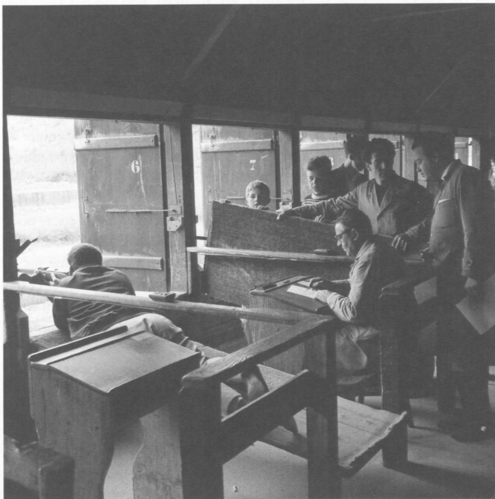
Le stand de tir des Neigles dans ses derniers instants, en 1963.