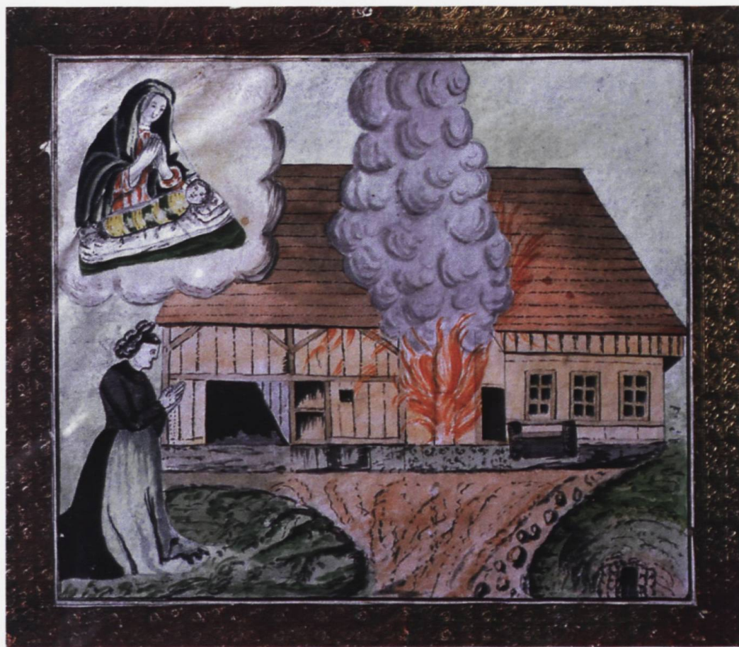
Incendie d'une ferme en Singine, ex-voto, XIX e s. Musée gruérien, Bulle.