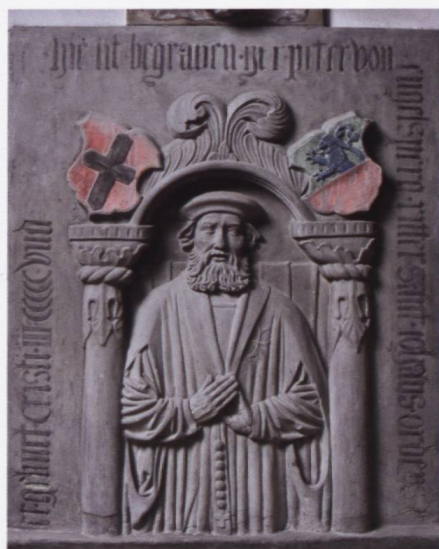
La stèle funéraire du commandeur Pierre d'Englisberg, dans l'église de Saint-Jean, et le relief de molasse polychromé à ses armes, au porche de la commanderie.

Or donc, la commanderie va renaître, entendons que ses bâtiments vont être restaurés pour abriter le Service cantonal des biens culturels, chassé de l'ancien couvent des Augustins par l'installation du Tribunal cantonal. Les travaux ont commencé par une mise à nu des éléments architecturaux (un démontage méthodique), et c'est une commanderie réduite à ses structures que le public invité par la Société d'histoire a pu visiter. L'occasion, certes, de découvrir l'archéologie des bâtiments implantés au XIII e siècle, ou de rêver à la magnificence des décors peints et des plafonds sculptés du XVI e .