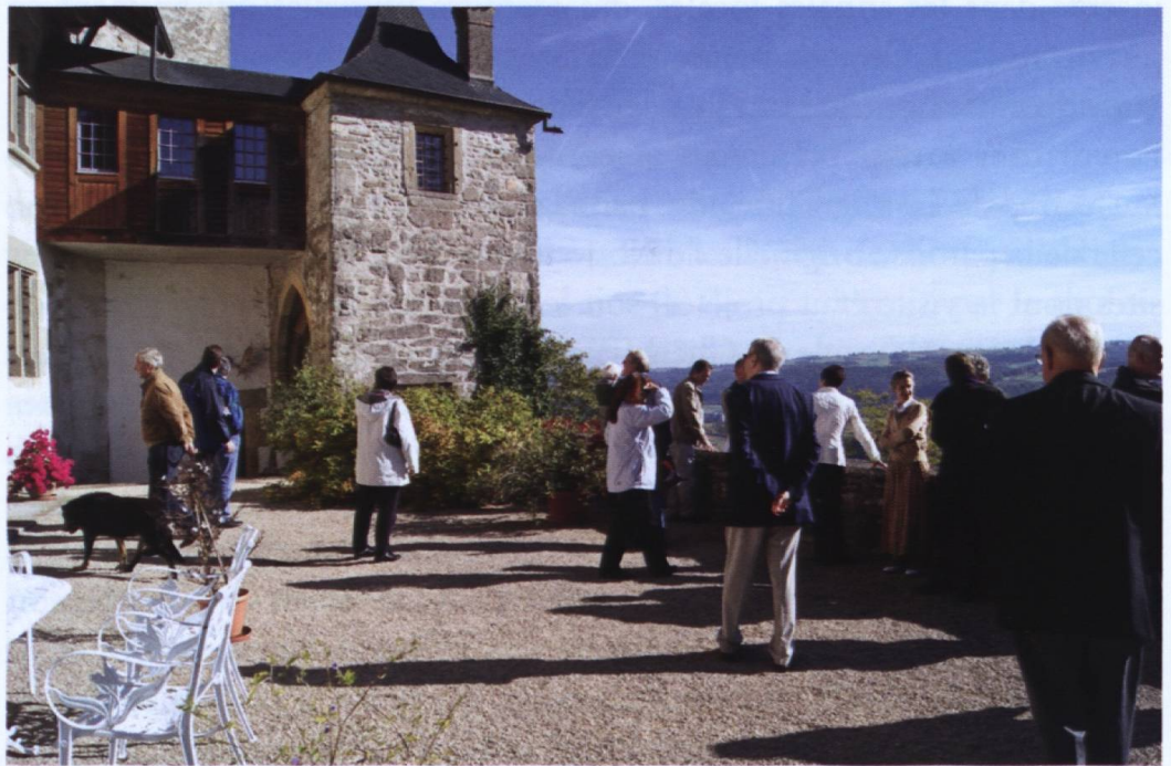
Les participants à cette balade historique sur la terrasse du château de Surpierre.