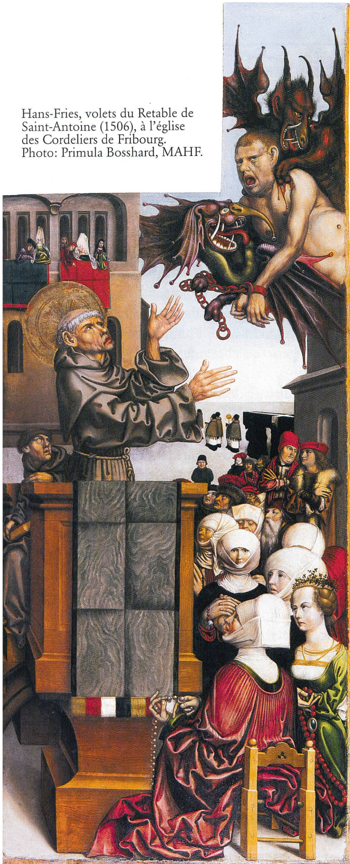
Hans-Fries, volets du Retable de Saint-Antoine (1506), à l'église des Cordeliers de Fribourg.