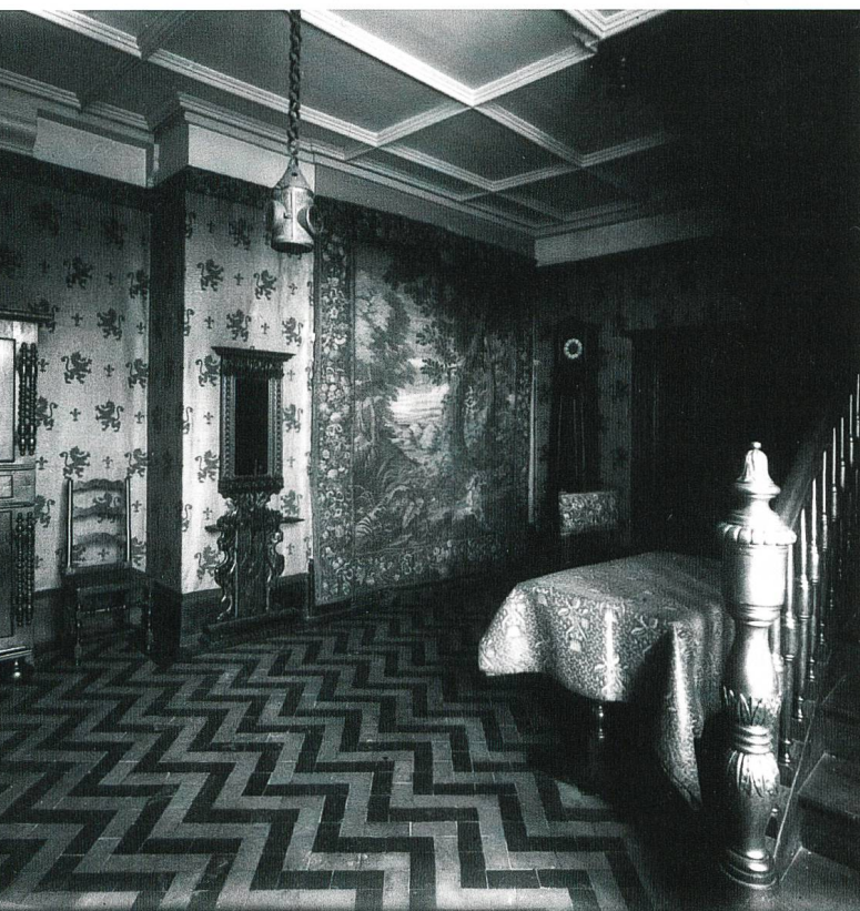
Le dallage et l'escalier intérieur du premier étage: les choix de la comtesse.