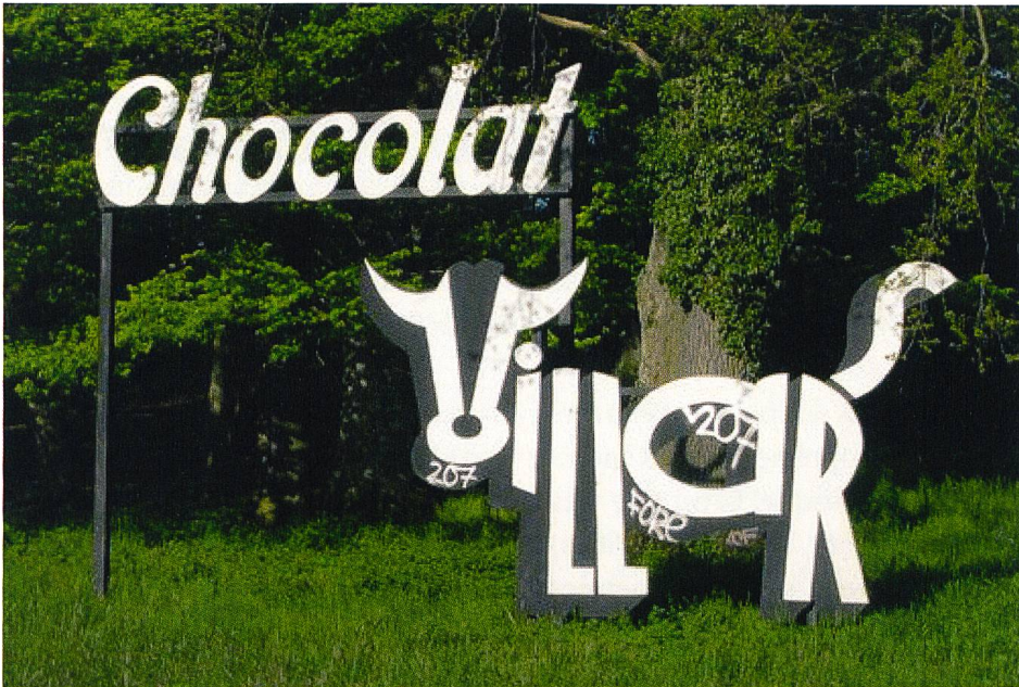
La vache Villars, une création de 1921 bientôt centenaire et toujours debout.

Or, un formidable retournement est en train de s'opérer. Voici que le chocolat ne sert plus seulement de vecteur ou de support à l'exploitation touristique du paysage, il devient lui-même une attraction touristique. Il concurrence les objets dont il faisait la promotion. La «maison Cailler» de Broc, détrônant le château de Chillon, est désormais le monument le plus visité de Suisse romande.