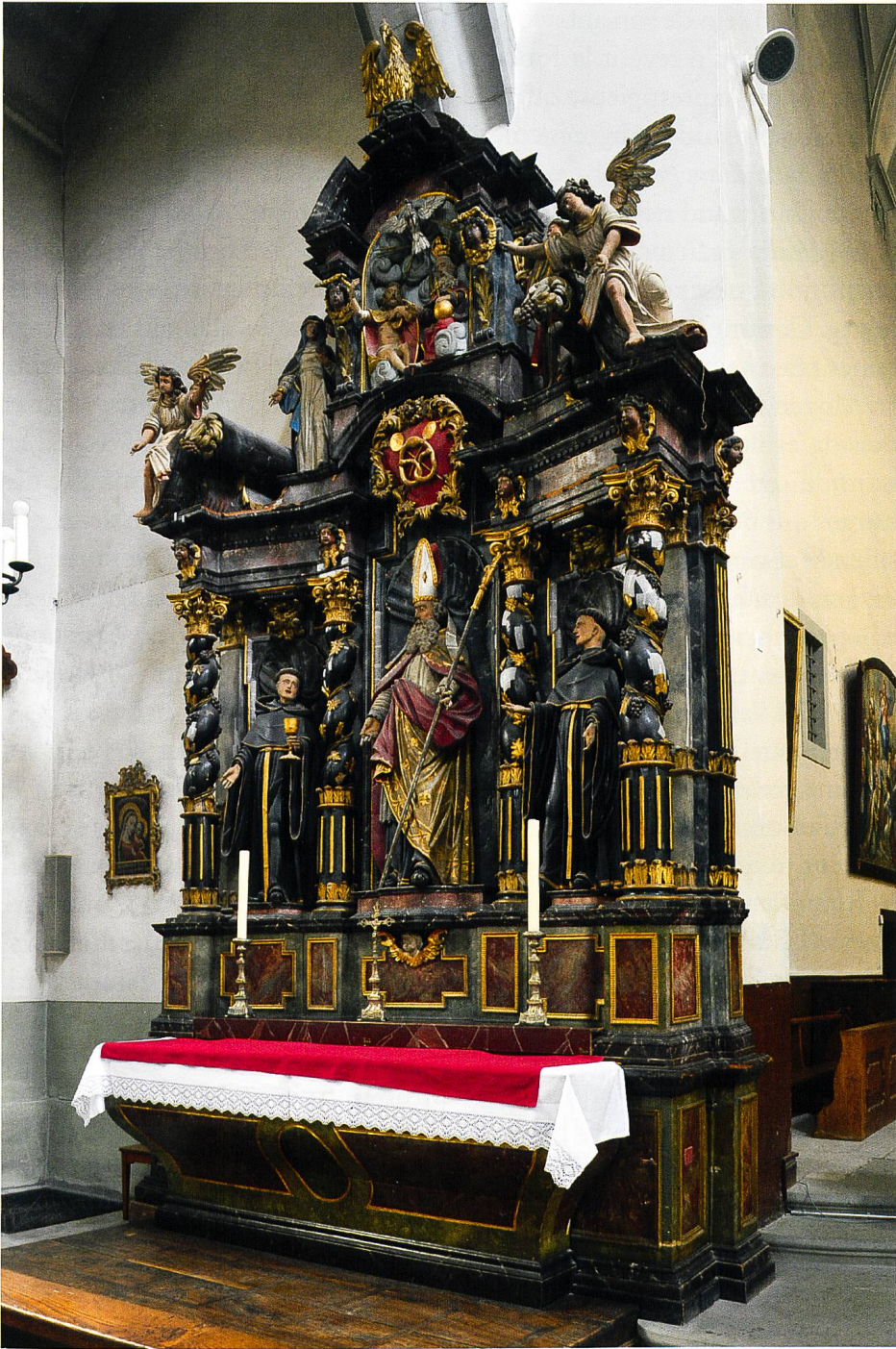
A l'église des Augustins, l'autel de saint Erhard dressé par l'atelier Reyff pour l'abbaye des Boulangers au temps où Hans-Ulrich Thürler en dirigeait la Confrérie (1686).