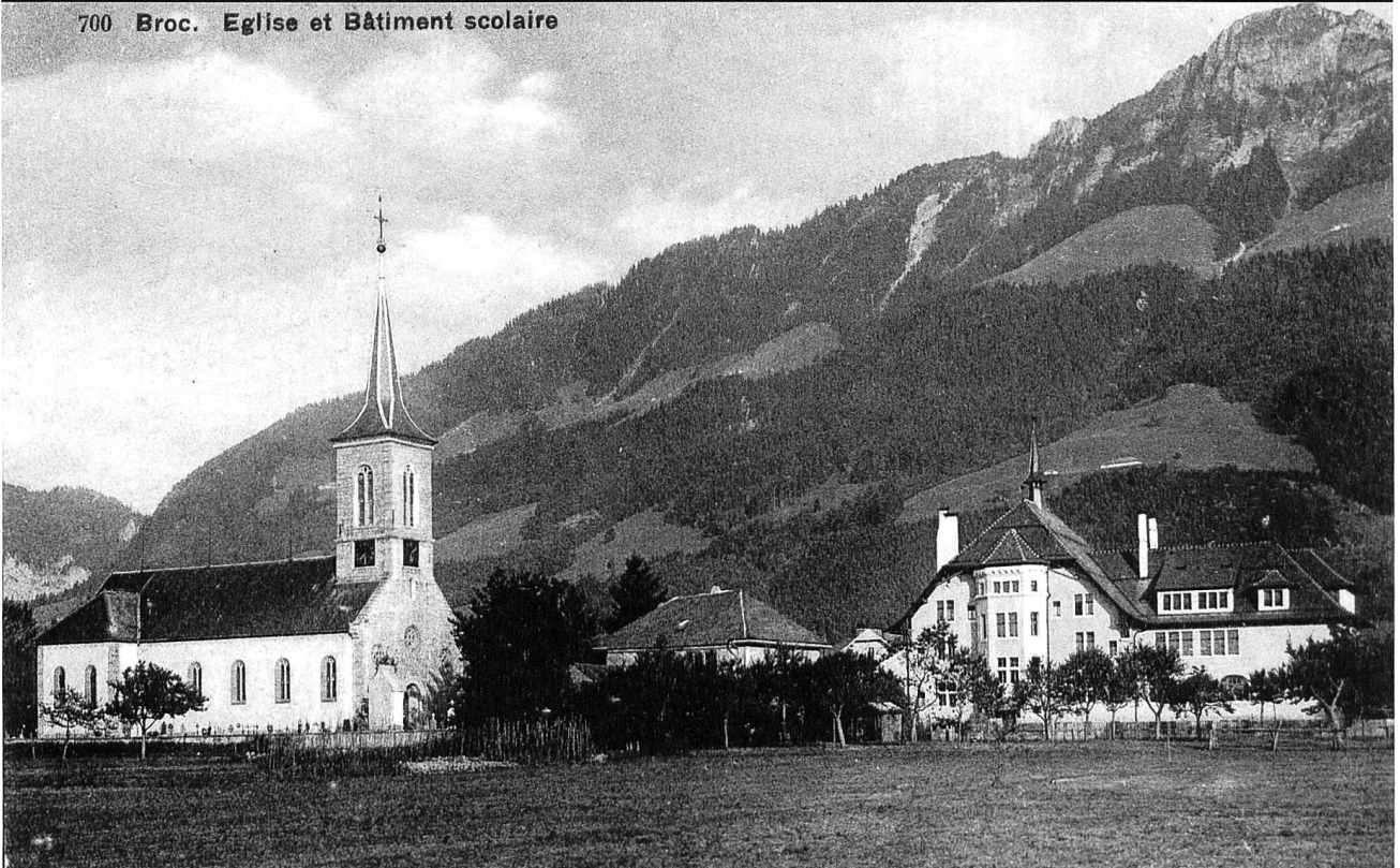
A droite, la nouvelle école de Broc, achevée en 1908.