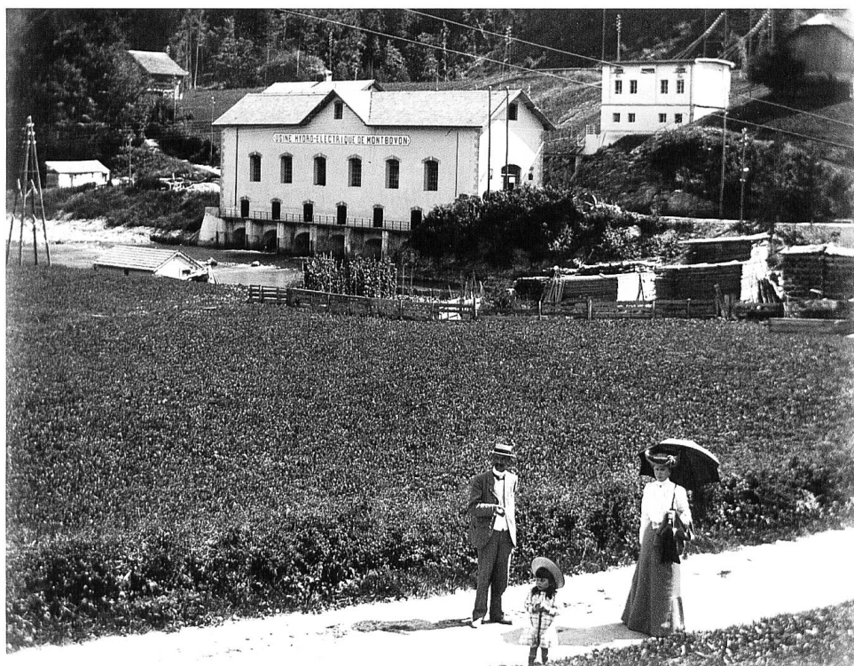
L'usine électrique de Montbovon mise en service en 1896.

Pourtant, cette agriculture va mal depuis l'arrivée des trains (ouverture de la voie Lausanne – Berne par Fribourg en 1862) qui permettent l'importation de céréales meilleur marché que celles produites sur place. Pour les paysans, c'est le début de difficultés qui ne cesseront plus, accompagnées d'un déclin qui les voit perdre 20 points dans la répartition de la main-d'œuvre entre les secteurs économiques, même si, au seuil du XX e siècle, ces paysans en représentent encore la moitié. Les espoirs formulés à propos du tressage de la paille vont bien dans ce sens : donner quelques sous supplémentaires à des familles qui restent paysannes et pauvres pour la plupart. Ces espoirs empreints d'une mentalité paternaliste et passéiste paraissent pour le moins dérisoires face au développement d'autres régions de la Suisse. Le préfet de la Gruyère ne peut que reconnaître ces disparités lorsqu'il parle, en 1908, des revenus « insignifiants » de cette activité (20 à 30 centimes par jour) 5 qui finira par disparaître complètement en 1914. L'insignifiance des salaires de la branche ne l'empêche pas de souhaiter, à plusieurs reprises, la création d'industries à domicile – il mentionne le développement « intéressant » de la dentelle, en 1912 et en 1913 – permettant de pallier l'insuffisance des revenus paysans, l'essentiel étant de maintenir le caractère rural de la population et de sa mentalité.