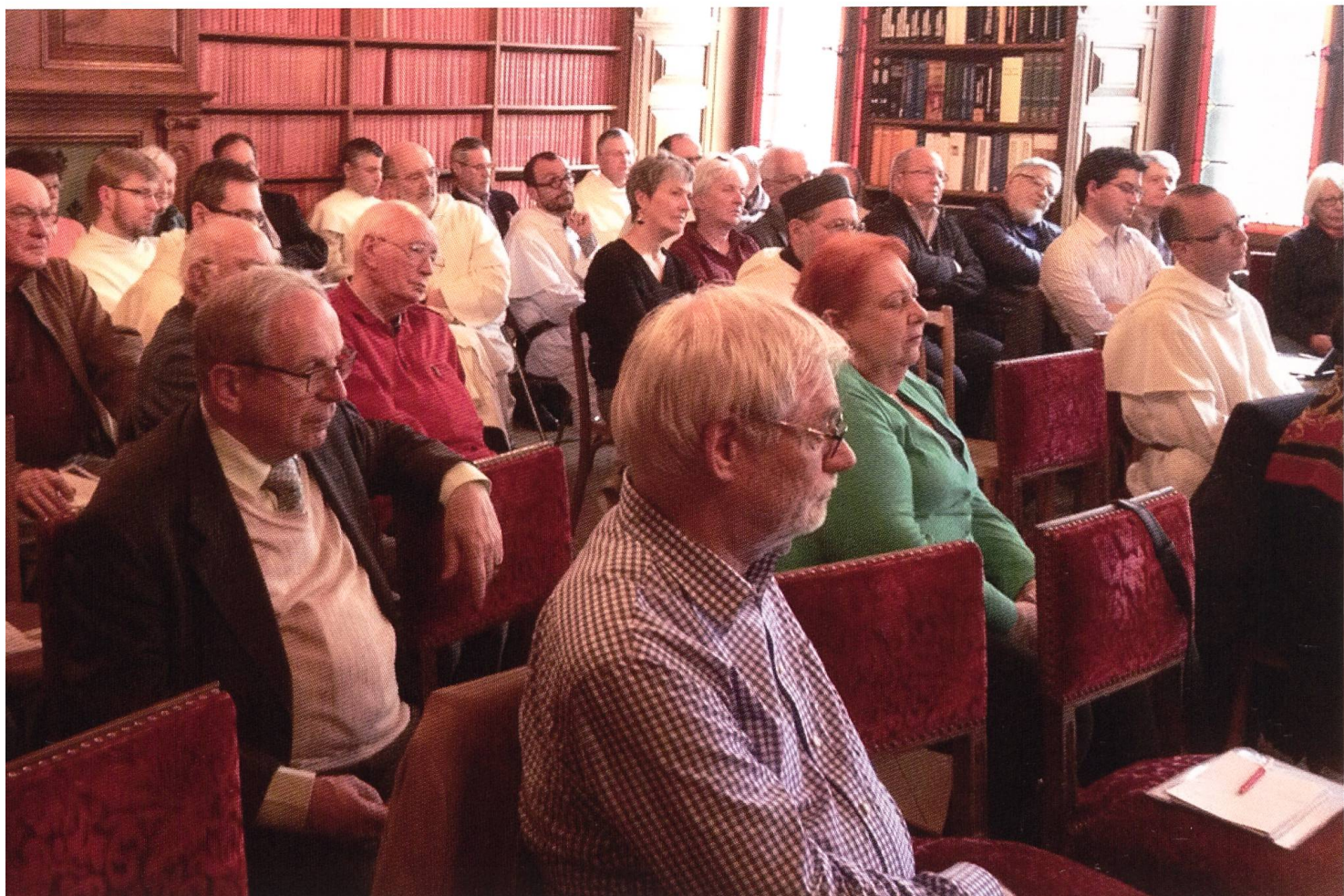
Journée d'étude sur le Chapitre général des Dominicains à Fribourg, 8 avril 2016.