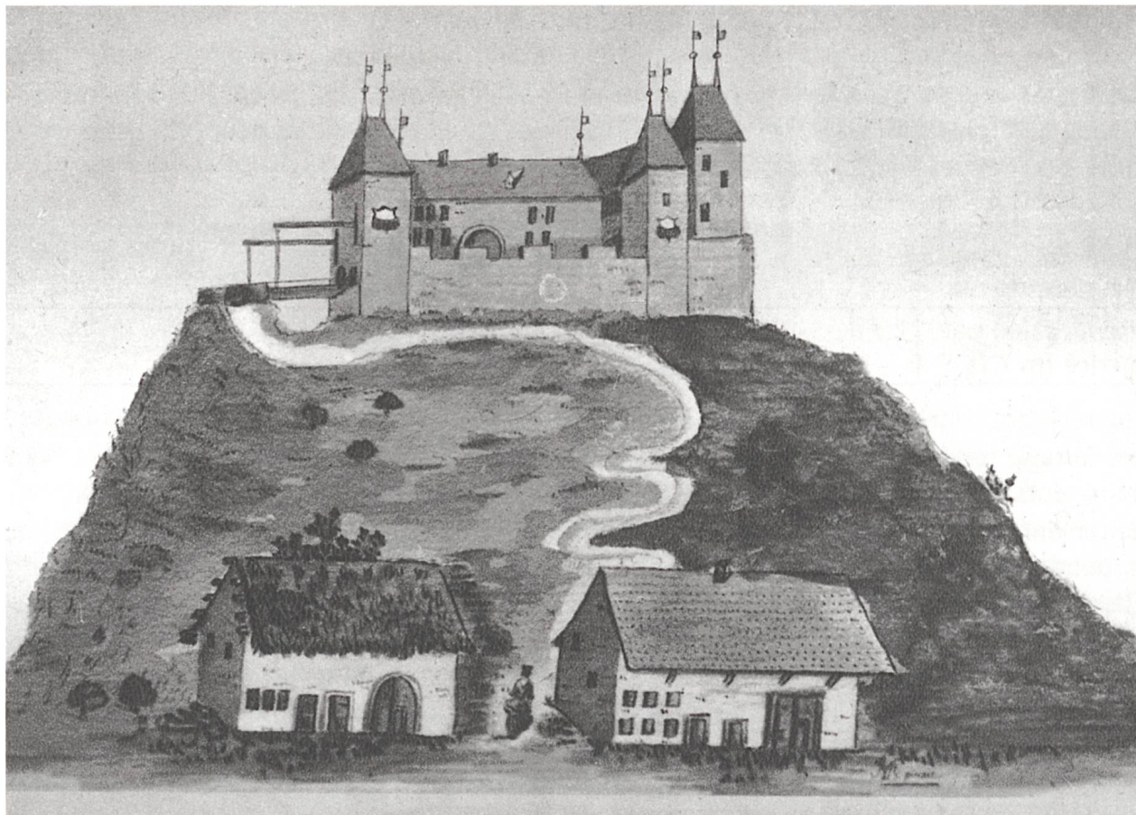
Fig. 1 Le château de Surpierre avec son pont-levis (début XIV e s.): vue d'ensemble selon plan cadastral (1788).