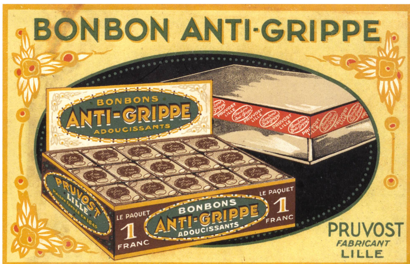
Fig. 6 Publicité pour des bonbons anti-grippe de la Maison Pruvost (Lille).

sans réponse. Mais au-delà des chiffres, l'angoisse, la souffrance et le deuil qui touche des centaines de familles fribourgeoises, unies dans la douleur avec des dizaine de millions de victimes dans le monde, auront marqué ce qui demeure la pire catastrophe sanitaire depuis le Moyen Âge.