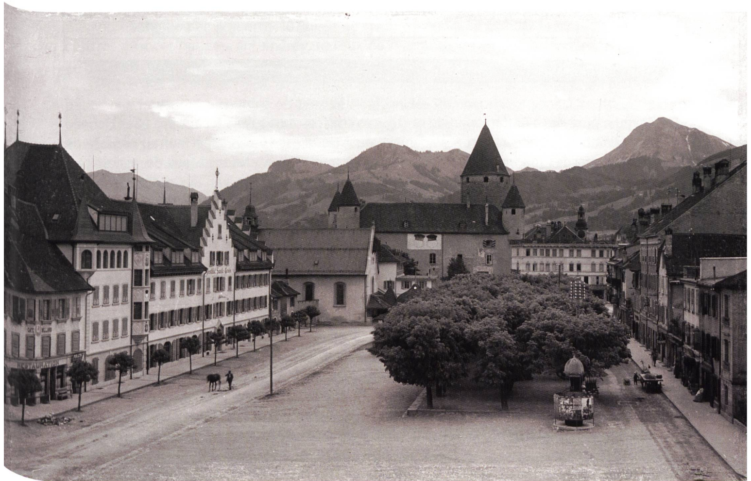
Fig. 5 À Bulle, l'Institut Sainte-Croix (à gauche sur le cliché) fonctionna comme lazaret durant l'épidémie.