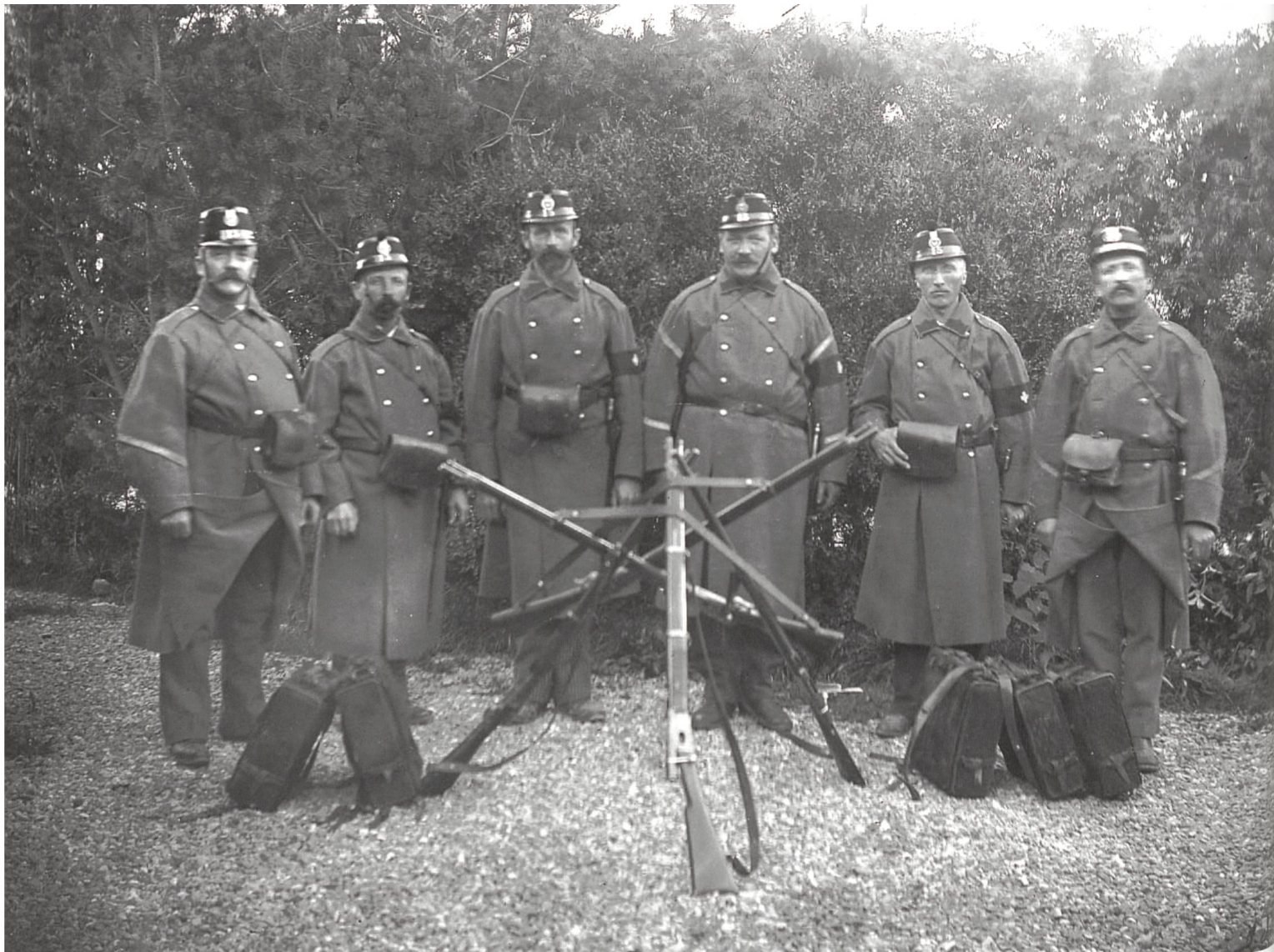
Fig. 2 Soldats fribourgeois du Bataillon 15 pendant le service actif 1914-1918.

plutôt effrayante de peste pulmonaire? Non; il ne s'agit réellement pas de cette terrible maladie, qui est ordinairement mortelle et dont les symptômes et les formes caractéristiques sont totalement différents. 24