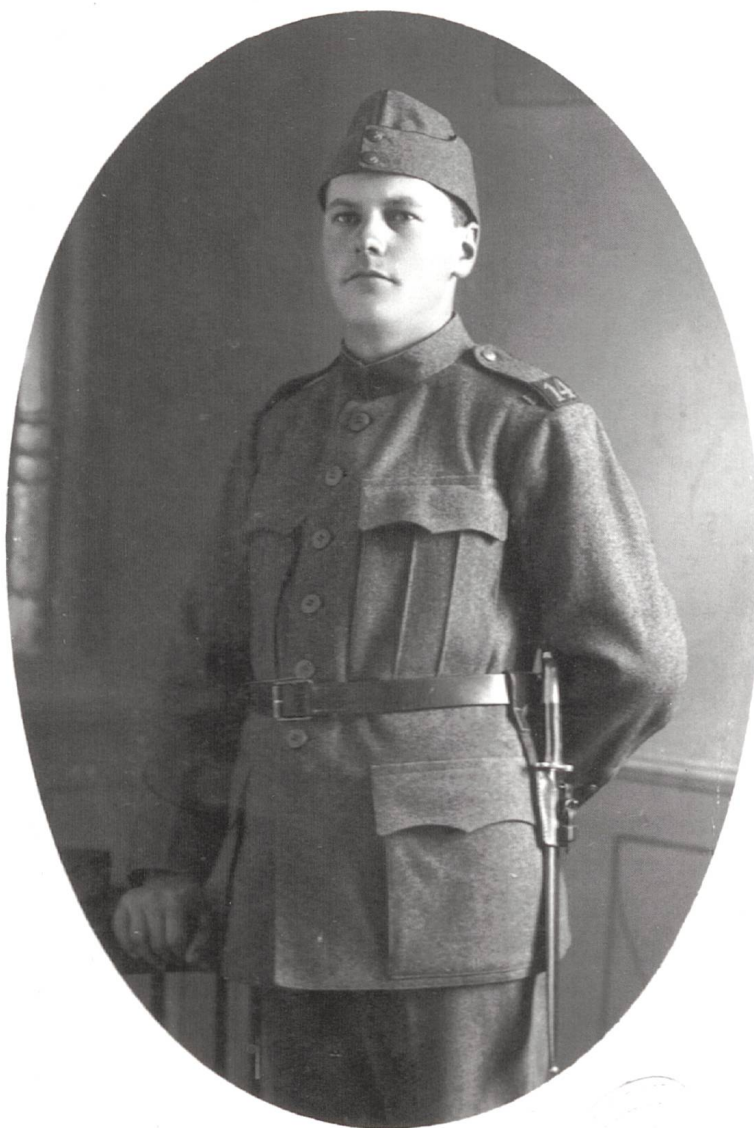
Fig. 1 Jeune soldat fribourgeois du Bataillon 14, vers 1918.

La maladie reste néanmoins, aux yeux de nombreuses personnes, quelque peu mystérieuse dans sa nature. Il y en a qui ne s'alarment pas et qui l'appellent influenza; d'autres qui s'alarment beaucoup et qui l'appellent peste pulmonaire; les gens du juste milieu l'appellent la grippe. Et chacune de ces catégories de baptiseurs trouvent des contradicteurs. (...). Voulons-nous insinuer que nous pencherions pour la désignation