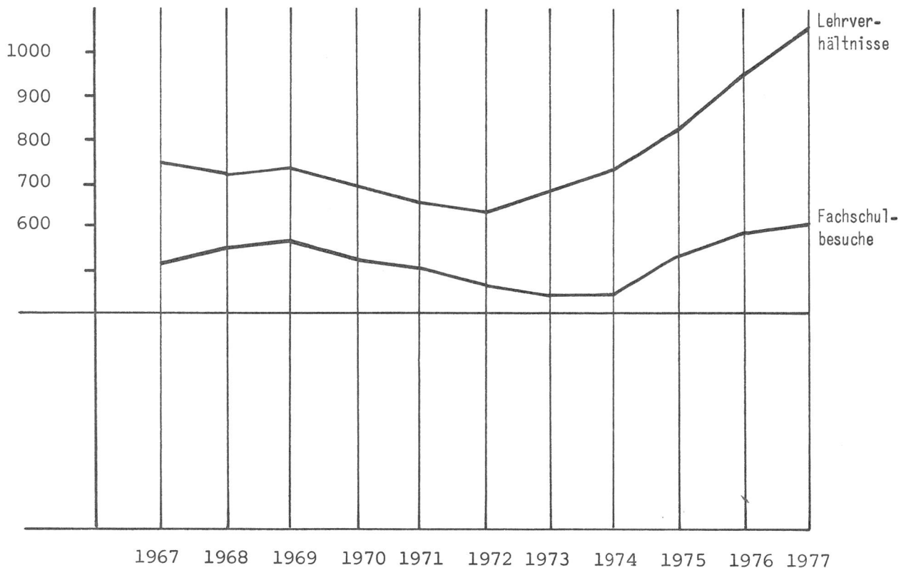
Entwicklung der Zahl der Lehrverhältnisse und Fachschülerzahlen im Kanton Bern 1967-1977

Der Landwirtschaftsbetrieb bietet der bäuerlichen Bevölkerung jedoch nicht nur Arbeitsort und Lebensraum, sondern garantiert in gewissem Mass diesen Arbeitsplatz (Schutz vor Arbeitslosigkeit) und ermöglicht eine minimale Existenz . Da auf dem Landwirtschaftsbetrieb zumindest immer die Grundnahrungsmittel für die Familie selber produziert werden können, bietet er die Möglichkeiten auch in Krisenzeiten die minimalsten Bedürfnisse zu decken. Neben der Nahrungsmittelproduktion spielt der Landwirtschaftsbetrieb als Kapitalversicherung in besondern Lebensumständen ebenfalls eine nicht zu unterschätzende Rolle. Diese Funktion der Betriebe lässt sich an der Entwicklung der Zahl der Lehrverhältnisse und Fachschulbesuche am Beispiel des Kantons Bern zeigen: