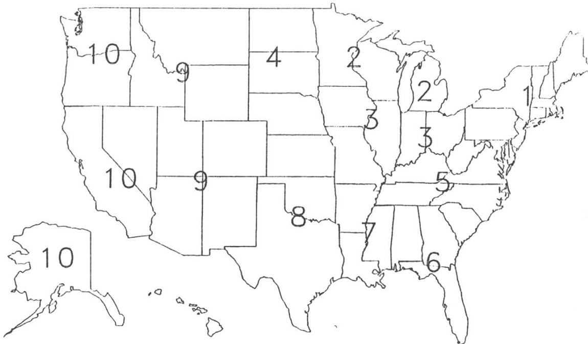
Abbildung 1: Agrarregionen der USA

Der Bundesstaat Michigan liegt zwischen den Grossen Seen im Nordosten der USA (Region 2 in Abbildung 1). Der Staat zählt rund 9 Millionen Einwohner. Der wichtigste Wirtschaftszweig ist die Automobilindustrie (mit Detroit als Zentrum im Südwesten des Staates).