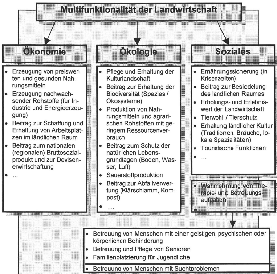
Abbildung 3: Multifunktionalität der Schweizer Landwirtschaft