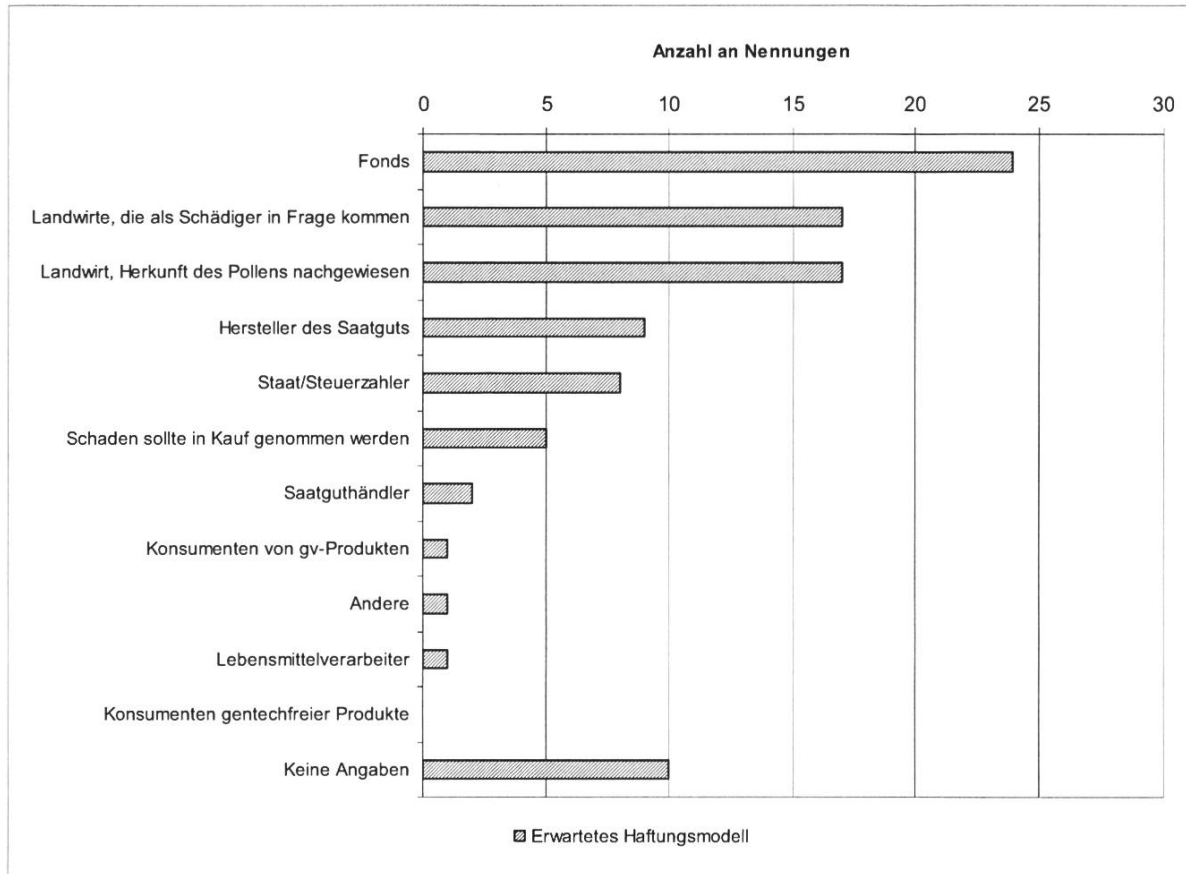
Abb. 3: Erwartetes Haftungsmodell (mehrfach Nennungen möglich).

Welches Haftungssystem die befragten Landwirte in der Schweiz zukünftig, bei Umsetzung der Koexistenz erwarten, zeigt Abbildung 3.