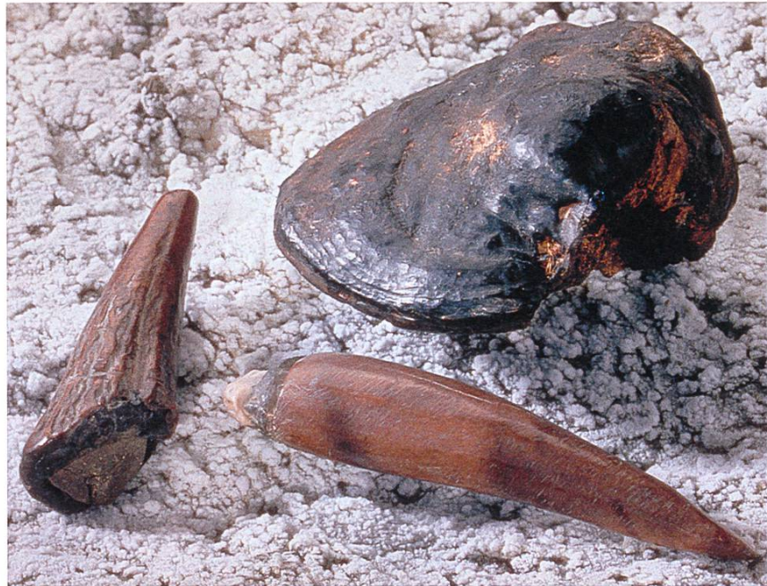
Abb. 4: Jungsteinzeitliche Feuerzeugutensilien bestehend aus Silex, Markasit (in Hirschgeweih geschäftet) und Zunderschwamm, um 3500 v. Chr..

Ein so gewonnener Abschlag konnte entweder direkt verwendet werden, oder er wurde zu einem eigentlichen Werkzeug weiterverarbeitet. Mithilfe eines Retuscheurs, eines Druckstabs aus Stein, Knochen, Geweih und in jüngeren Zeiten auch aus Metall, liessen sich kleine Absplisse herausdrücken. Mit dieser Technik konnten Sägezähnen in eine Klinge eingearbeitet oder Werkstücke nachgeschärft werden. An der flächig retuschierten Pfeilspitze, die im Abri L1 bei der Fundstelle Plan da Mattun (Val Urschai) gefunden wurde, kann man die Spuren dieser Arbeit gut erkennen. Im Umfeld einer altmesolithischen Feuerstelle aus dem 9. Jahrtausend v. Chr. wurde unter dem Abri L2 im Jahr 2009 zudem – neben sehr vielen Silexabsplissen – ein unverbrannt erhaltenes Geweihgerät geborgen. Möglicherweise wurde dieses Objekt vor 11 000 Jahren als Retuscheur zum Ausbessern bzw. Schärfen von Waffen und Werkzeug verwendet (Abb. 7-9).