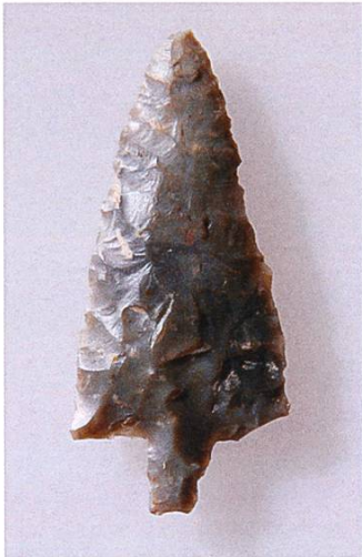
Abb. 1: Silexpfeilspitze aus der bronzezeitlichen Siedlung Ramosch-Mottata (Foto: T. Reitmaier).

stein war gewissermassen der «Stahl» der Steinzeit. Wegen seiner Härte (Mohshärte 6.5-7) und seinem spröden, muscheligen Bruchverhalten, kann er zu messerscharfen Klingen geschlagen werden. Die Menschen in prähistorischer Zeit benutzten ihn zur Herstellung unterschiedlichster Waffen und Werkzeuge, u.a. von Pfeilspitzen (Abb.1), Messern oder Schabern, um überschüssiges Fleisch von einer Tierhaut zu entfernen. Auch lange nach der «Steinzeit» verwendete man Silex, beispielsweise als Flintsteine in Steinschlossgewehren oder um damit Feuer zu erzeugen. Letzteres war für das Überleben im Hochgebirge von zentraler Bedeutung und ermöglichte ausserdem die Urbarmachung neuer landwirtschaftlicher Nutzflächen durch Brandrodung. (Abb.2–6). Im Laufe der Zeit wurden die Techniken zur Feuersteinbearbeitung weiterentwickelt und auch verfeinert. Grundsätzlich gibt es drei wichtige prähistorische Schlagtechniken: