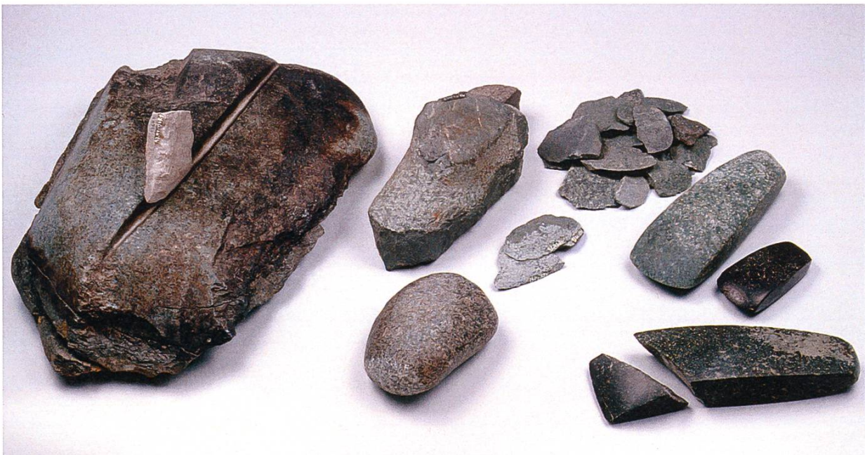
Abb. 15: Jungneolithische Feuchtbodensiedlung Arbon-Bleiche 3 TG, Produktionskette eines Beiles aus Grüngestein.

Die sesshaften Ackerbauern und Viehzüchter der Jungsteinzeit entwickelten neuartige Werkzeuge wie Beile, Äxte und Dechsel (quer geschäftete Klinge) aus Felsgestein, um Wälder zu roden und Häuser zu bauen (Abb. 15). Dabei wurden bevorzugt metamorphe Gesteine verwendet, deren physikalische Eigenschaften durch hohe Temperaturen und Druck verändert wurden. Typische Beispiele für solche Metamorphosen sind die Entstehung von Gneis aus Granit oder die Umwandlung von Kalkstein zu Marmor. So genannte Grüngesteine wie Serpentinite, Eklogite, Nephrite oder Jadeite waren aufgrund ihrer Eigenschaften und ihrer äusseren Erscheinung besonders beliebt. Sie finden sich in Ophiolithen, wie sie im Wallis oder in der Arosa-Zone vorkommen. Ophiolithe sind Reste ehemaliger Ozeanböden, die bei der Gebirgsbildung auf den Kontinent geschoben wurden. Grünge-