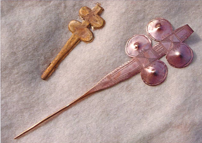
Abb. 17: Rohguss und überarbeitetes Endprodukt einer frühbronzezeitlichen Doppelflügelnadel.

Der Fund einer mittelbronzezeitlichen Gussform aus Lavez zur Herstellung eines Rasiermessers in Rapperswil-Jona am Zürichsee beweist, dass das Material nicht nur in den Alpen beliebt war, sondern auch im Mittelland Verwendung fand.