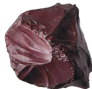
Abb. 11: Val Lavinuoz, Plan S. Jon: Radiolaritnukleus (Feuerschlagstein?), undatiert. Mst. 1:1.

Im Mesolithikum, der mittleren Steinzeit zwischen 8500 und 5500 v. Chr., streiften Jägergruppen auf der Suche nach Beu-