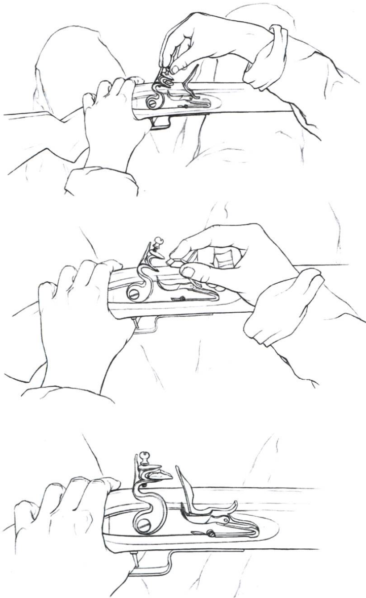
Abb. 3: Auswechseln des