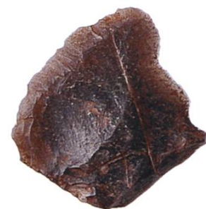
Abb. 13: Val Tuoi, Abri Frey: Mesolithisches Quarzitartefakt. Mst. 1:1.

Als Zwischenergebnis der laufenden Untersuchungen kann gesagt werden, dass im Silvrettagebiet sowohl lokales Rohmaterial verwertet wurde, als auch Feuersteine, die von einer Einbettung in ein transalpines Handelsnetz zeugen. Der Einfluss