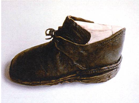
Abb. 3: Porchabella-Gletscher, geborgener Lederschuh aus der Zeit um 1700.