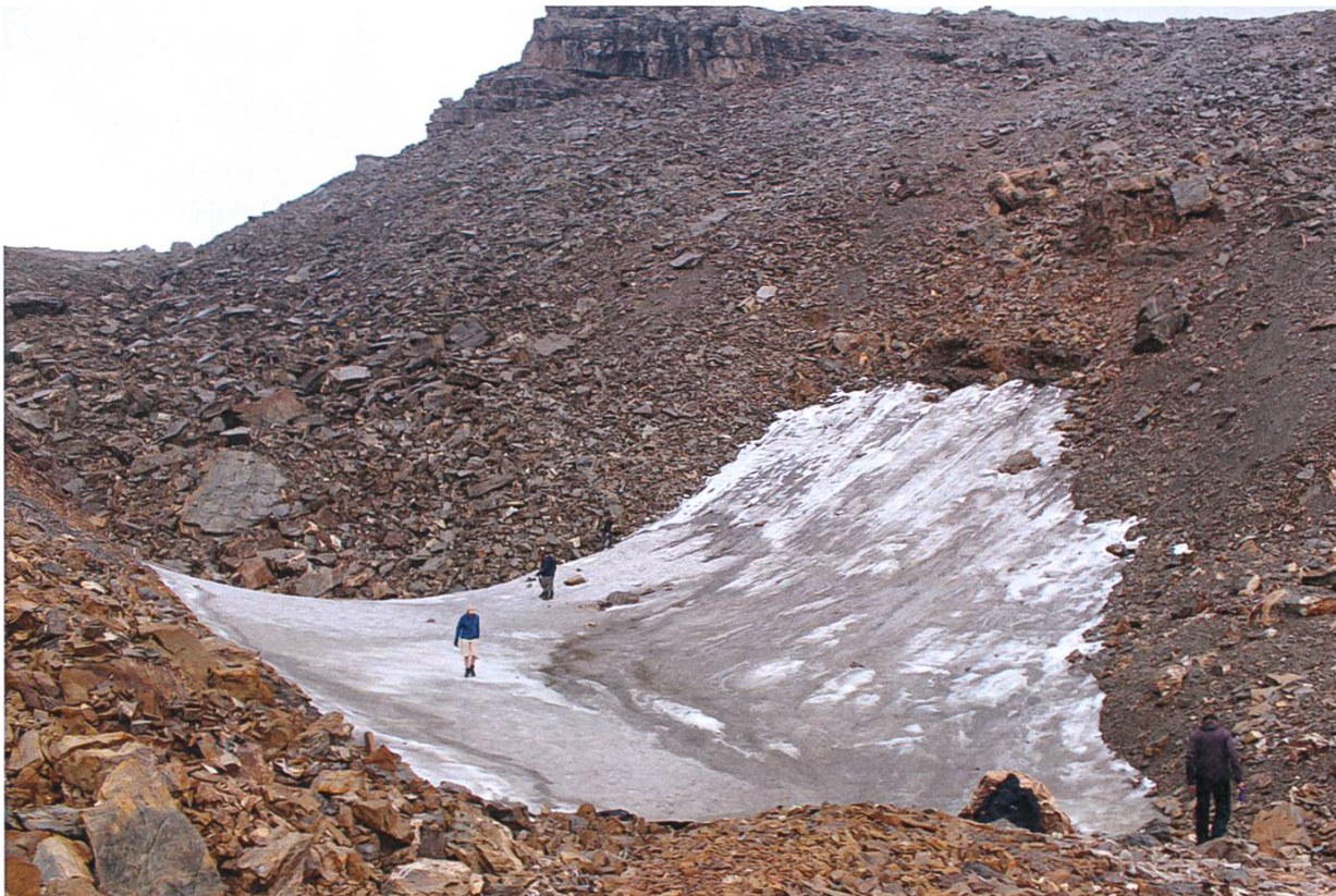
Abb. 10: Prospektion eines noch weitgehend mit Schnee bedeckten Eisfeldes unterhalb der Fuorcla Davo Dieu, Sept. 2011.

Die im Zuge dieser Arbeit erstmals als archäologisches Funderwartungsgebiet registrierten Eisfelder in der Silvretta werden in Zukunft in regelmässigen Abständen begutachtet, um mögliche Funde rasch und fachgerecht zu sichern. Daneben sollen aber auch Zustand und Entwicklung der Eisfelder fortlaufend