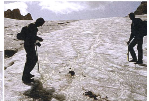
Abb. 1 und 2: Porchabella-Gletscher/GR, Situation mit Leichenresten und Ausrüstungsgegenständen während der Bergung durch den Archäologischen Dienst Graubünden, 1992 (Foto: Archäologischer Dienst Graubünden).