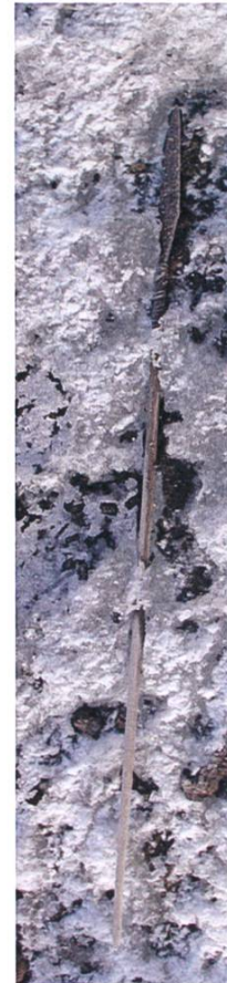
Abb. 6: Rasch schmelzendes Eisfeld mit Fundobjekten aus fünf Jahrtausenden bei Storbreen, Oppdal/Norwegen (Foto: M. Callanan (NTNU)).