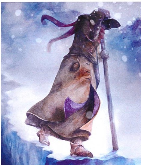
Abb. 4: Ein Lebensbild? Tod durch Spaltensturz – Rekonstruktion der Porchabella-Hirtin (Illustration: E. Bösch/ZHdK).

al. 2005; Vanderhoek et al. 2007a). Obwohl die Entdeckung der Gletscherleiche Ötzi bereits mehr als 20 Jahre zurückliegt und die Auswirkungen des Klimawandels in den Alpen allgemein bekannt sind, blieb eine entsprechende systematische Erforschung von Eisfeldern als mögliche Kultur- und Klimaarchive im Alpenraum bisher fast gänzlich aus. Die Entdeckung und Bergung von archäologischen Funden aus dem Eis, wie beispielsweise auf dem Berner Schnidejoch und Lötschenpass (Hafner 2009; 2010), wird im Alpenraum weiterhin mehrheitlich dem Zufall überlassen und bleibt daher die Ausnahme. Bereits 1988 wurden auf dem Porchabella-Gletscher/GR die Reste einer Frauenleiche entdeckt (Rageth 1995). Die ebenfalls geborgenen Bekleidungs- und Ausrüstungsgegenstände (Holzschale, Löffel, Kamm, Rosenkranz, Filzhut, Wollkleidung, Lederschuhe) identifizieren sie als junge Hirtin, die wohl um 1700 durch einen Spaltensturz zu Tode gekommen ist (Abb. 1–4). Vor diesem Hintergrund drängt sich die Frage nach dem gletscherarchäologischen Potential des teilweise stark vergletscherten Silvrettamassives geradezu auf. Die optimalen Erhaltungsbedingungen im Eis führen bekanntlich dazu, dass auch aus organischem Material gefertigte Objekte konserviert werden. Funde dieser Materialgattung, die in der alpinen Archäologie regelhaft unter- bis gar nicht vertreten ist, könnten das bisher erarbeitete archäologische Bild der Silvretta entscheidend erweitern.