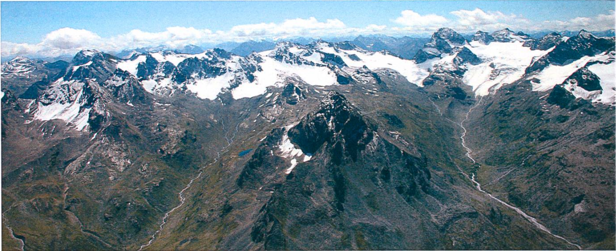
Abb. 7: Vergletscherte Silvretta mit Bieltal und Ochsental, Piz Buin und dem Vermuntpass, Sept. 2008.