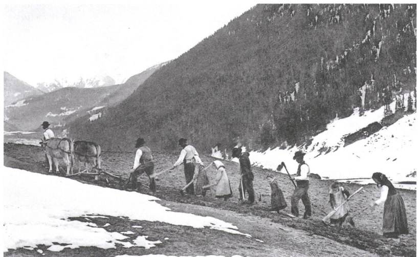
Abb. 137: Bündner Oberland. Aufnahme 1920er Jahre.

Die vergleichenden Bilder Abb. 136; Abb. 137 eignen sich als Hinweis auf eine