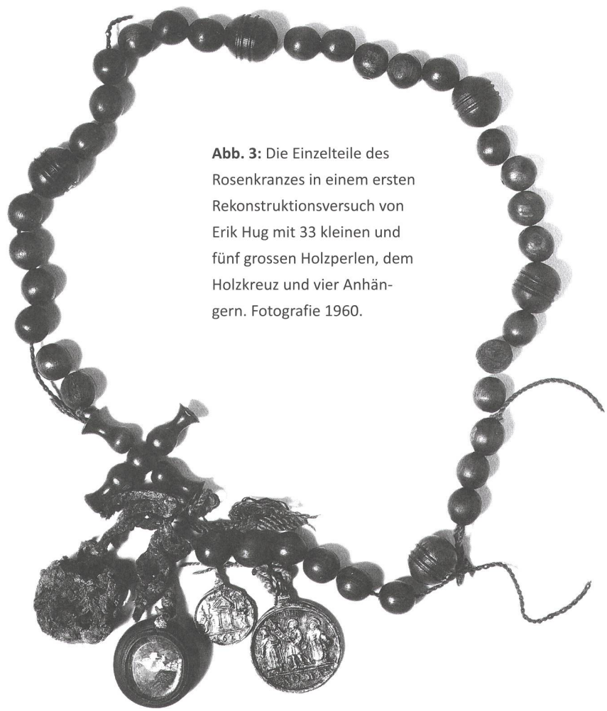
Abb. 3: Die Einzelteile des Rosenkranzes in einem ersten Rekonstruktionsversuch von Erik Hug mit 33 kleinen und fünf grossen Holzperlen, dem Holzkreuz und vier Anhän- gern. Fotografie 1960.