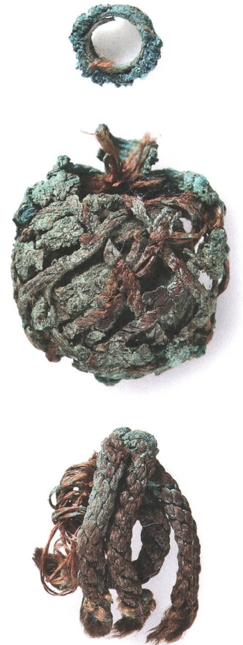
Abb. 14: Die zwei Bestandteile des Posamenterieanhängers mit der abgebrochenen Öse (Objekt D). Mst. 2:1. Fotografie 2010.