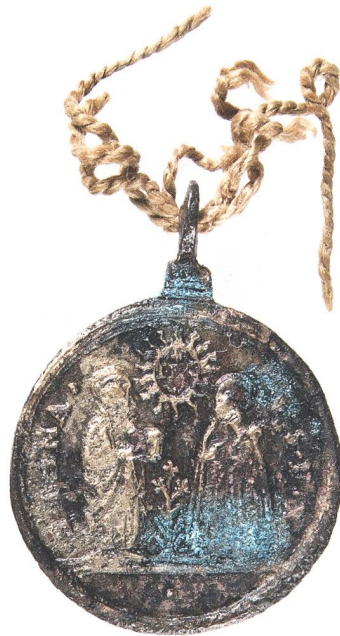
Abb. 11: Rückseite Gnaden- medaille (Objekt B). Mst. 2:1. Fotografie 2010.