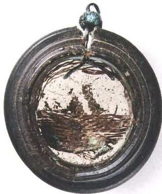
Abb. 9: Reliquiar (?) (Objekt A), heutiger Zustand. Ansicht von hinten. Mst. 2:1. Fotografie 2010.