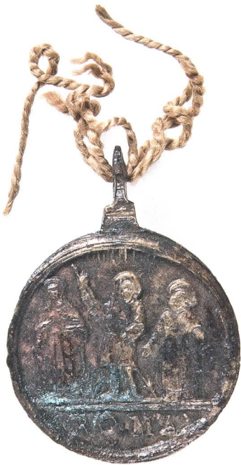
Abb. 10: Vorderseite Gnaden- medaille (Objekt B). Mst. 2:1. Fotografie 2010.