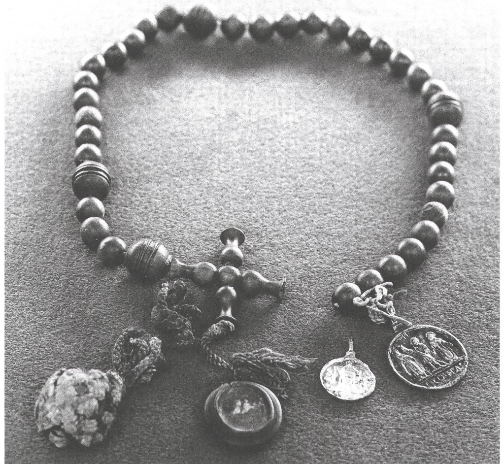
Abb. 4: Hugs zweiter Rekon- struktionsversuch mit nur vier grossen Holzperlen, ansons- ten aber denselben Einzel- teilen. Fotografie 1960.