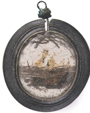
Abb. 8: Reliquiar (?) (Objekt A), heutiger Zustand. Sicht durchs Glas. Mst. 2:1. Fotografie 2010.

Erhaltungszustand: aufklaffender Riss im Holz bei der Ösenbohrung. Draht der Öse stark korrodiert und nur mehr im Kern erhalten. Drahtumwicklung der Öse mit aufliegender Korrosion erhalten. Das in den Hug'schen Unterlagen noch erwähnte zweite Glas fehlt. Kettfäden des Textils kaum mehr vorhanden.