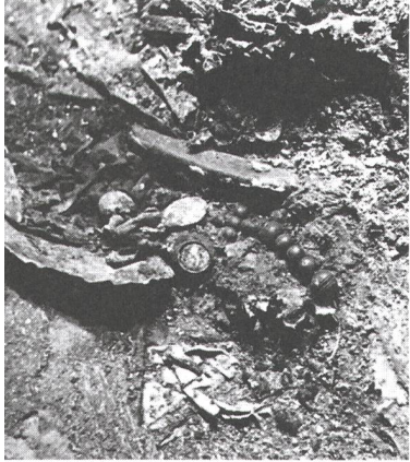
Abb. 2: Chur, Kathedrale St. Mariae Himmelfahrt. Teile des Rosenkranzes in ihrer Fundlage im Jahre 1959.