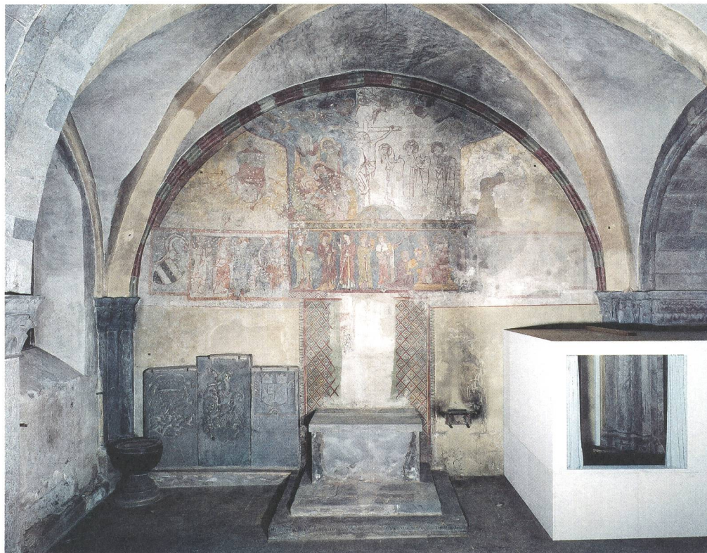
Abb. 1: Chur, Kathedrale St. Mariae Himmelfahrt, 2004. Nordwand des Westjoches im nördlichen Seitenschiff (Taufkapelle) mit Malereien aus drei verschiedenen Epochen über dem Katharinenaltar. In der Wandmitte Fresken des Waltensburger Meisters , ca. 1330–1350. Existierten damals zu beiden Seiten dieser Malerei hölzerne Einbauten? Ganz rechts im Bild Wände der temporären Raumabtrennung, wodurch das nördliche Seitenschiff während der Restaurierung des Innenraums weiterhin für die Öffentlichkeit zugänglich blieb.