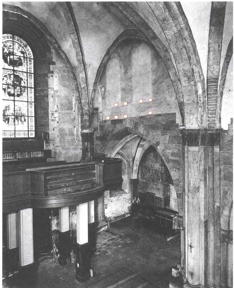
Abb. 2 (linke Seite): Chur, Kathedrale St. Mariae Himmelfahrt, 1924. Nordwand des Mittelschiffes mit Lage der zugemauerten Hochgadenfenster und der damals festgestellten Balkenreihen im Westen der Wand. Längsschnitt durch die Kathedrale von Walther Sulser, hier im Mst. 1:400. Original: Denkmalpflege Graubünden.

Abb. 3: Chur, Kathedrale St. Mariae Himmelfahrt, 2003. Nordwestbereich des Mittelschiffes während des Abbaus der Empore an der Westwand. Fotomontage der 1924 festgestellten Balkenreihen an der Hochwand des Mittelschiffes über dem Eingang in die Taufkapelle. Blick nach Nordwesten.