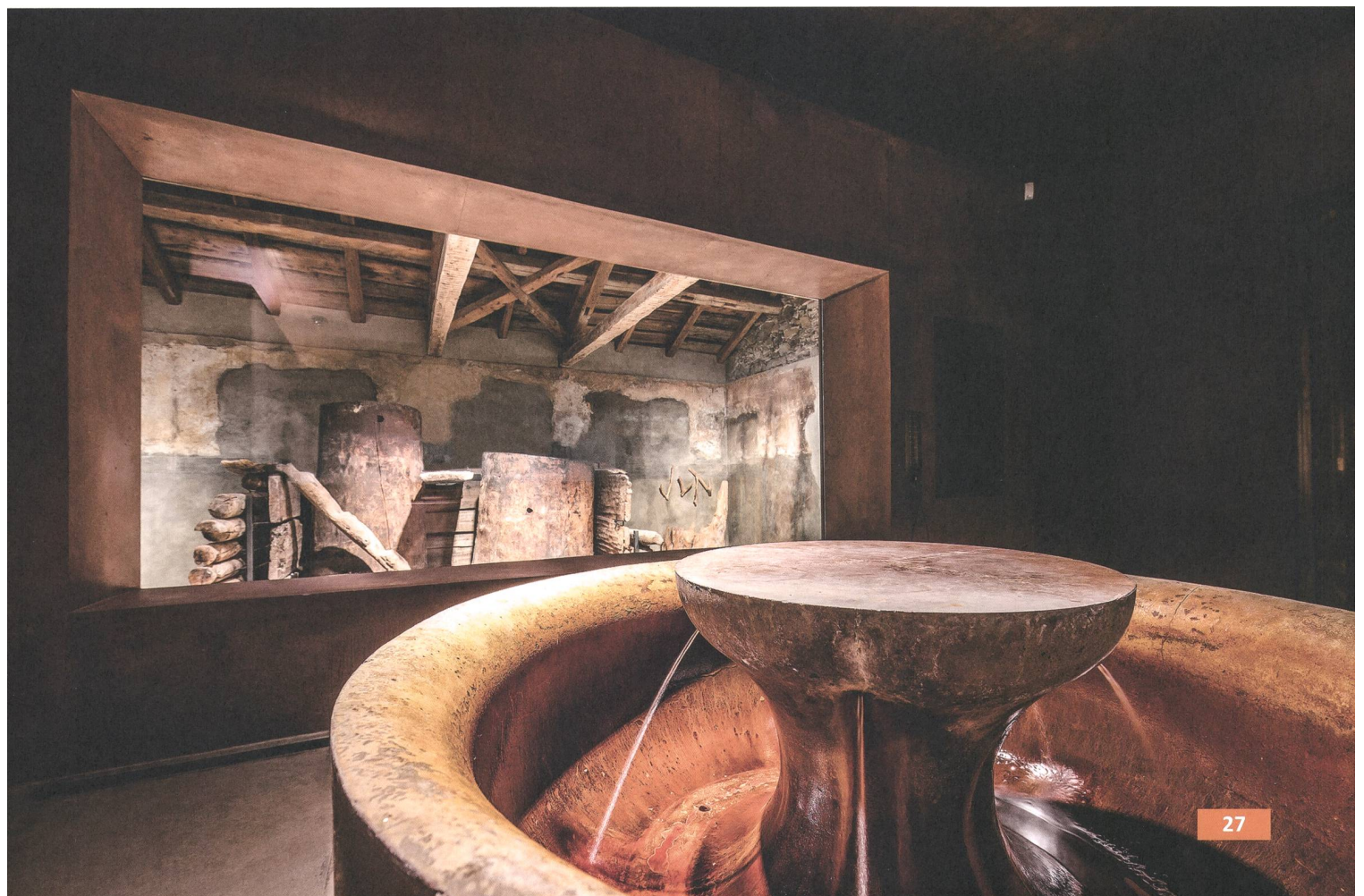
Abb. 7: St. Moritz-Bad, Forum Paracelsus, 2015. Ausstellungsraum mit Trinkbrunnen.

Bei der Verwendung sowohl als Trink- wie Badewasser verbessert sich die Durchblutung, Stresshormone wie Adrenalin und