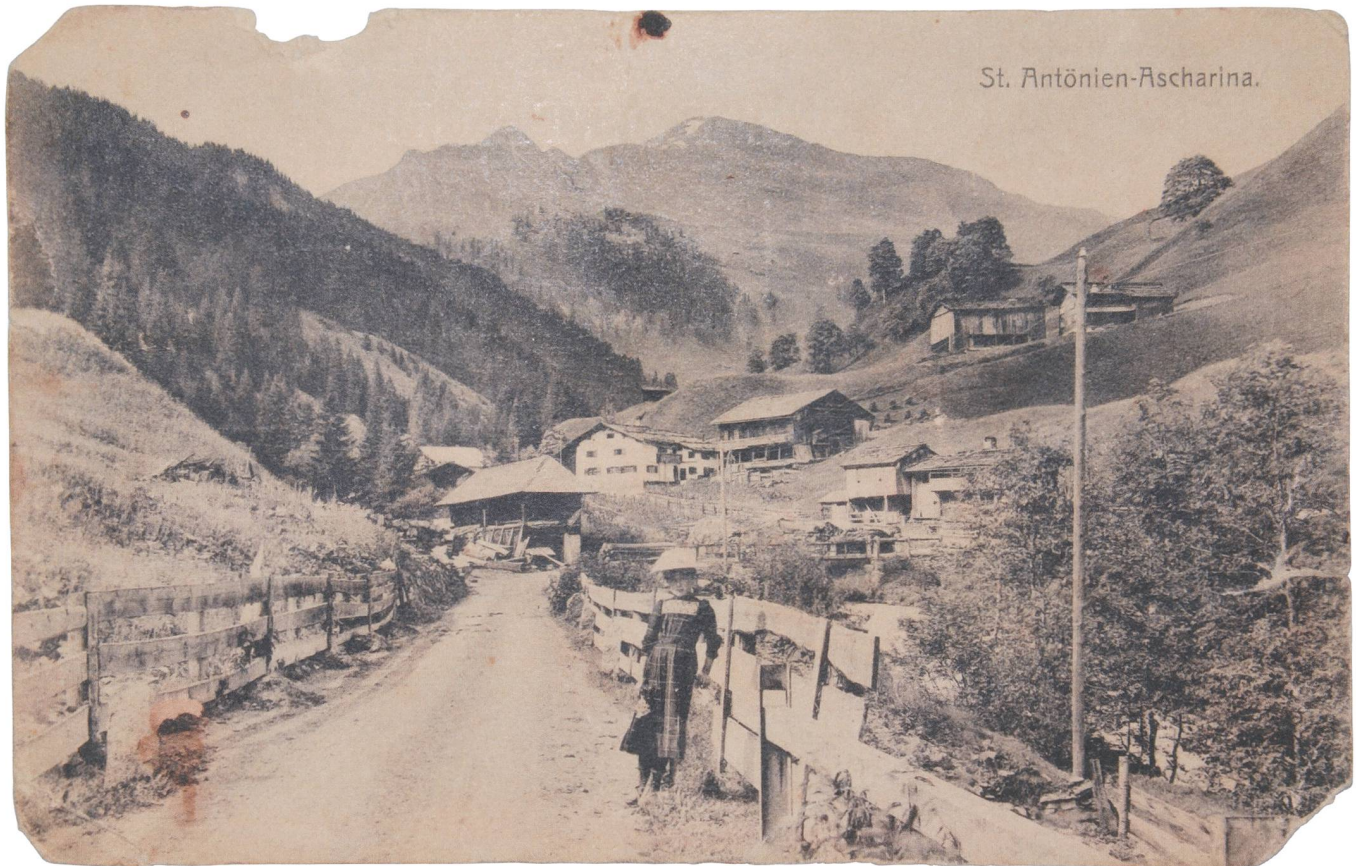
Abb. 57: Die Kommunalstrasse von Dalvazza über Luzein und Pany bis St. Antönien-Ascharina wurde 1898/99 mit einer Breite von 3,2 m ausgebaut.

Im St. Antönierthal selbst begann der Strassenausbau sehr zögerlich und spät. Die «Ruosch-Chronik» teilt mit: «1885. Nach langjährigen Kämpfen beschließt die Thalschaft, ein Sträßchen längs dem Schanielabach zu erstellen. Diese Richtung wurde darum vorgezogen, weil die Panier u. Luzeiner eine Beteiligung abgelehnt hatten. Das Sträßchen, das 1885 in Angriff genommen u. 1886 erstellt wurde, führt von Dalvazza-Brücke bis in die Stelli [= St. Antönien-Ascharina] u. hat bei einer Breite von 2–2 ½ Meter eine Länge von 5,8 km Abb. 56. 262 Nach Beaugenscheinung durch die Standeskommission wurde dasselbe in der Frühjahrsession des Großen Rathes 1887 in das Straßennetz aufgenommen u. die Concession zum Bau einer Communalstraße bis St. Antönien-Platz erteilt.» 263 Der Botanikprofessor Carl Schröter aus Zürich fand 1895 keine lobenden Worte für die Anlage und den Zustand dieser Strasse. 264