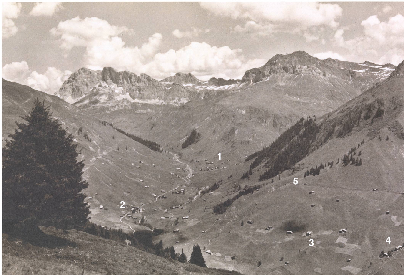
Abb. 52: Blick vom «Chrüz» auf St. Antönien, undatierte Aufnahme.