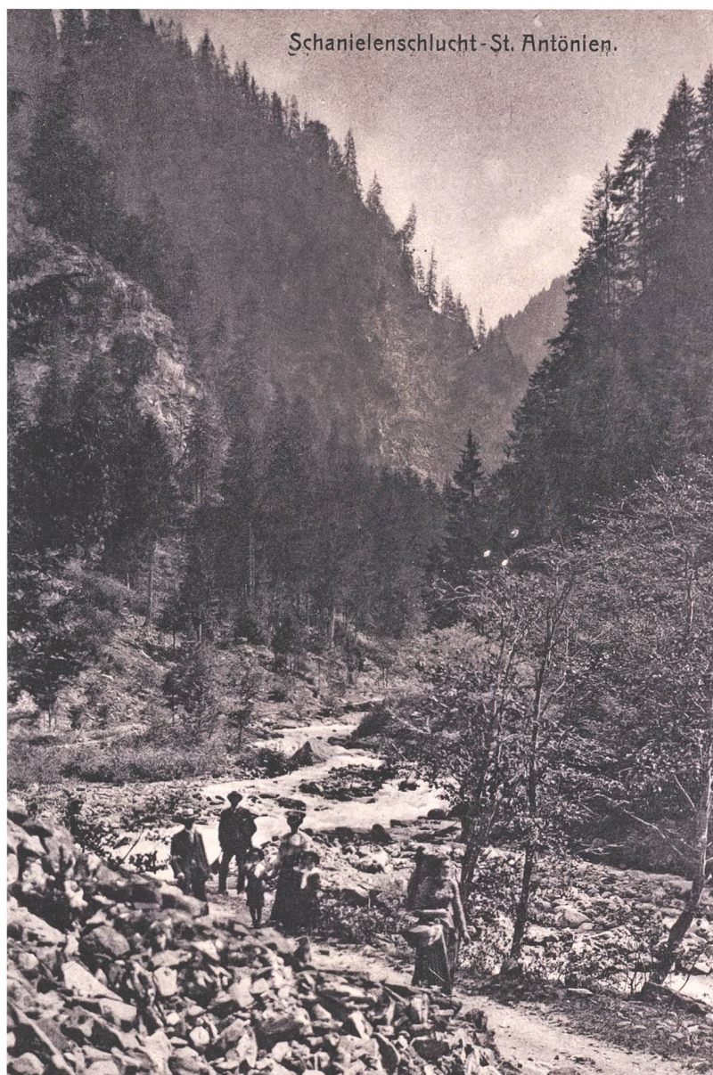
Abb. 56: Die neue 1885/1886 erbaute Strasse im Schanieltobel. Sie führte von der Dalvazza-Brücke bis nach St. Antönien-Ascharina.

Die schwierigen Wegeverhältnisse änderten sich zumindest im Prättigau erst mit dem Bau der Prättigauerstrasse von Landquart nach Davos. 259 Der Bau wurde 1842 begonnen und 1860 fertiggestellt. 260 Ab 1863 verkehrten Postkutschen auf der ganzen Strecke zwischen Chur und Davos. Erst die Fertigstellung der Rhätischen Bahn von Landquart nach Davos 1889/1890 veränderte die Transportmöglichkeiten und -kosten in diesem Teil Graubündens grundlegend. 261