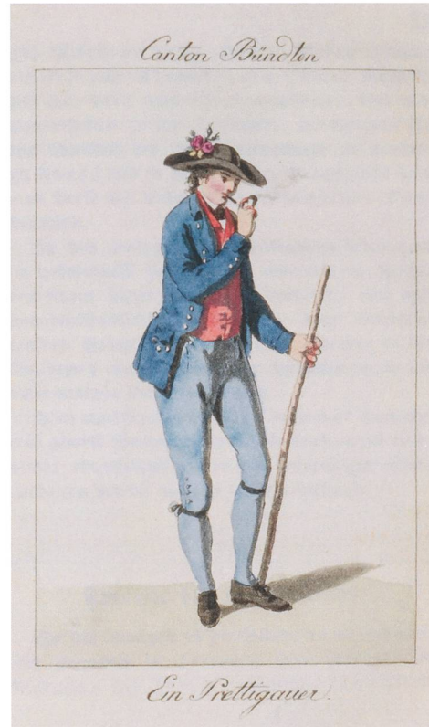
Abb. 54: Ländliche Kleidung im Prättigau um 1800, abgebildet im Helvetischen Almanach 1806.