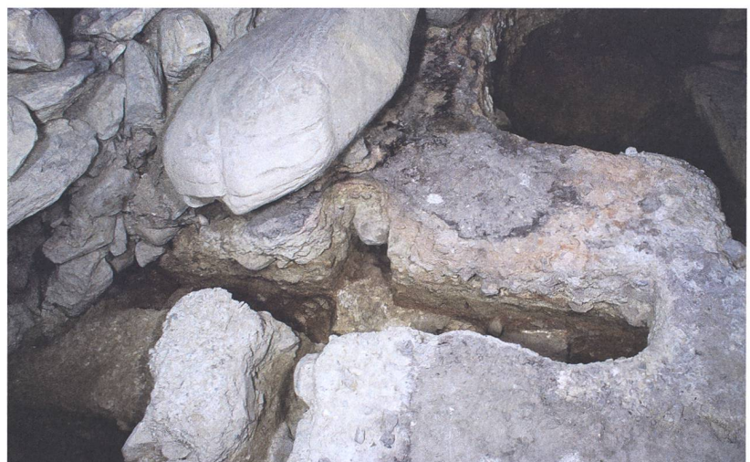
Abb. 312: Tomils, Sogn Murezi. Anlage 4b. Raum J. Brandschicht (1091) auf dem Mörtelboden (1090). Blick nach Westen.

Probe Nr. 26 ). Die dendrologische Untersuchung ergab, dass die Holzprobe von jenem Bereich nahe an der Waldkante stammt und somit nicht viele Jahre bis zum Fälljahr des Baumes hinzugerechnet werden müssen. Das Brandereignis ist demnach wohl in die Zeit um 900, jedoch vor den Abgang der Kirchenanlage (vor 940) zu verorten.