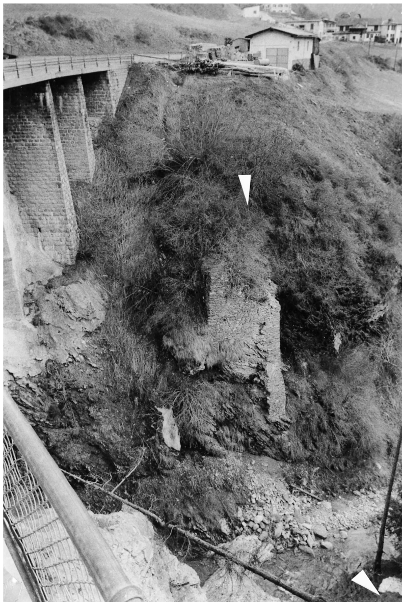
Abb. 1: Valsot. Ramosch (Stelle 1.1). Brücke über die Brancla bei Ramosch. Im oberen Bildteil (Pfeil) der Brückenpfeiler aus dem 18. Jahrhundert. Blick nach Osten.

Der heutige Feldwegbau ab Punkt 1191 hat den älteren Talweg auf dasselbe Trasse vorerst zerstört. Dann ist er aber als Gebüschstreifen mit der bergseitigen Böschung, stellenweise mit talseitig erhaltener Stützmauer, gut zu erkennen (Stelle 1.2) bis er vom Schutt des Felsausbruches der heutigen Talstrasse komplett zugedeckt wird. Talseits von der letzten Kehre der