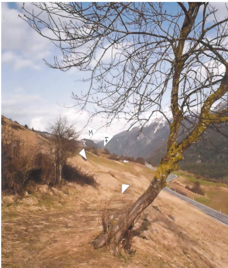
Abb. 2: Scuol, Sent (Stelle 1.6). Alter Talweg mit der Pedra Fitta F und der bronzezeitlichen Siedlung Mottata M in Ramosch. Blick nach Nordosten.

durch bezwang. Dann führte der neuzeitliche Talweg bestimmt auf dem heutigen Niveau weiter.