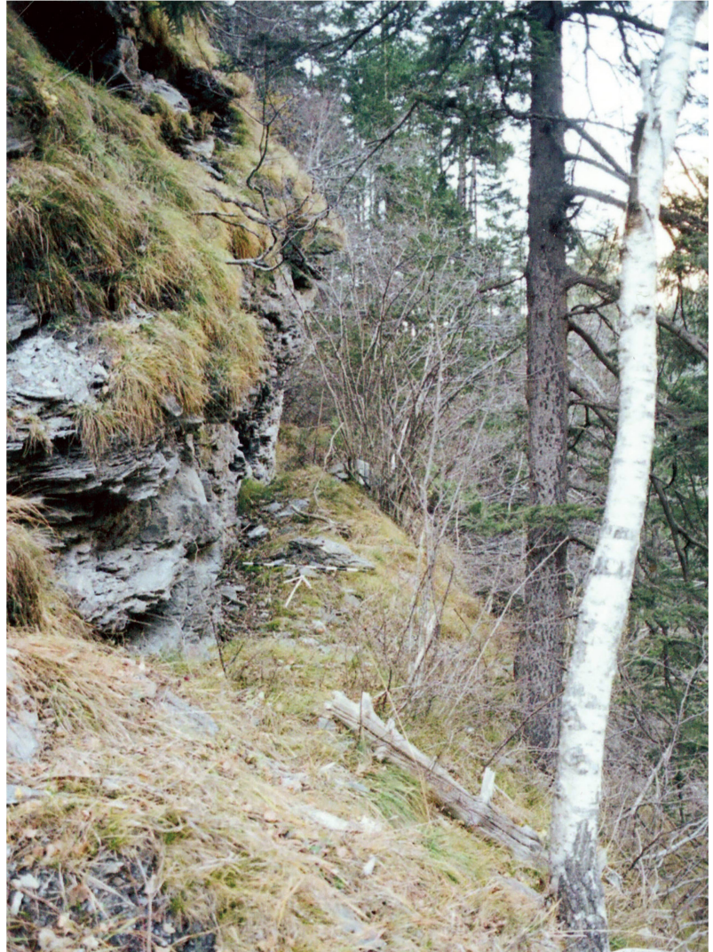
Abb. 115: Thusis, Viamala (Stelle 15.2). Neuzeitlicher Weg am Schluchteingang, von Rongellen her kommend. Ausbruch im Fels am Ende des noch sichtbaren neuzeitlichen Weges. Blick nach Norden.

Nämlich: nach dem Bachübergang im rechtsseitigen Hang des Aclatobels unterhalb Rongellen zieht sich ein alter Weg praktisch horizontal in Richtung Süden dahin. Vorerst ist zu erkennen, dass er noch lange benutzt wurde, aber nach der kleinen Ebene (Stelle 15.1) präsentiert er sich voll und ganz in jenem Zustand, in dem man ihn verliess. Das muss wohl im Zusammenhang mit dem Durchbruch der Kommerzialstrasse durch das «Verloren Loch» im Jahre 1820 geschehen sein. Also, der Weg durchquert den ganzen Steilhang Richtung Schlüsselstelle in der Viamala. Er wird dabei immer weniger, wird vom heutigen Waldweg geschnitten, taucht aber wieder tiefer, etwas flacher auf, ist dann in der folgenden Runse ganz abgerutscht und präsentiert sich nach der Runse sinkend auf der anderen Seite als ca. 40 m langer Felschnitt (Stelle 15.2, Abb. 115 ) mit sechs Sprenglöchern, die einen Durchmesser von ca. 37 mm aufweisen. Danach wurde er vom späteren Strassengaleriebau ganz zerstört. Ohne Zweifel hatte dieser Weg einen Anschluss an die von Christian Wildener 1738 erbaute, neue südliche Brücke in der Viamala. Die Annahme, letztere und der beschriebene Weg seien Zeitgenossen, ist naheliegend und wird auch von der Dimension der Sprenglöcher bestätigt.