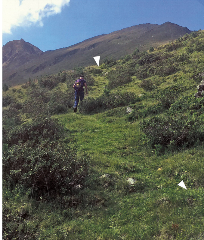
Abb. 114: Stuben–Pfunds (A) (Stelle 14.3). Zadresjoch, Ost-seite (ca. 2245 m ü. M.). Fortsetzung von Stelle 14.2 , nördlich des Bächleins. Blick nach Südwesten.

Traverse muss also angelegt worden sein, denn ihre Konsequenz in der Steigung, Breite und Länge verraten eine unerwartete Grosszügigkeit – ein Handanlegen!