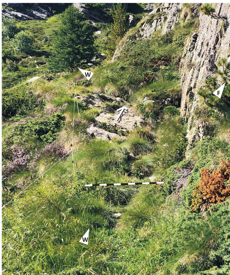
Abb. 110: Bregaglia. Casaccia – Val Maroz (Stelle 13.3). In der Fortsetzung der Stelle 13.2 durchquert der alte Weg den Südosthang praktisch horizontal. D Hangdurchquerung. F Felsrippe bei Stelle 13.2. L linke Talseite am Alpascellabach mit sehr markanter Stelle 13.1. Blick nach Südosten.

Wenn wir mit der Begehung unten anfangen, so stellen wir fest, dass der jetzige, beim Kraftwerkbau erstellte Alpweg das älteste Wegtrassee durchschnitten hat. Da der Hang steil ist, ist der Schaden so gross, dass unterhalb des neuen Weges keine Spuren älterer Wege auszumachen sind. Oberhalb aber ist ein eindeutiges, wunderbares, gegen den Bach hin steigendes Trassee gut zu erkennen. Teilweise ist es etwas zugeschüttet, teilweise abgerutscht, aber es führt unmissverständlich zum nächsten Rücken (Stelle 13.1), nach dem Rücken zum Alpascellabach, immer weniger greifbar. Unmittelbar nach der Bachüberquerung präsentiert sich ein wunderbar steigender Weg, welcher dann kurz fallend um die folgende Felsrippe (Stelle 13.2, Abb. 109 ) führt. Darauf durchquert er den Südosthang praktisch horizontal. Heute noch stellt der Hirt den Viehzaun unbewusst auf den ehemaligen Weg (Stelle 13.3, Abb. 110 ). Nun geht es rechts um die Ecke in den Südwesthang, welcher zum höchsten Punkt steigend, gequert wird (Stelle 13.4, Abb. 111 ). Dieser Weg muss ab hier fallend, möglicherweise dem heutigen Trassee entsprechend, zum Pass-/Alpweg von 1805 geführt haben.