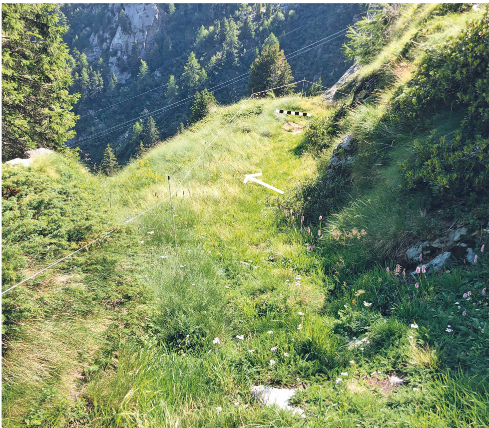
Abb. 109: Bregaglia. Casaccia – Val Maroz (Stelle 13.2). Alter Weg, leicht abfallend um die Felsrippe führend. Blick nach Südwesten.

Auf einer Exkursion mit Gästen hatte ich das Glück, dass ich längere Zeit warten musste. Dabei sass ich gelangweilt, meditativ in Gedanken versunken, auf dem rund geschliffenen Granitfelsen östlich des Baches Alpascella, talseits der Strasse. Mein Kopf drehte sich hin und her, wie die Gedanken auch, und plötzlich ein Aufwachen mit der Erkenntnis: Da kann der alte Weg nicht durchgegangen sein! Dieser Granitfelsen war vor dem Sprengzeitalter nicht zu bezwingen ... Also gab es nur die Möglichkeit, den alten Weg obendurch zu suchen, wo er auch zu finden ist. Da präsentiert sich ein noch nicht erkanntes, ca. 600 m langes Trassee, welches das Rätsel der Bachquerung, von dessen Zugang und dessen Fortsetzung vor 1805 gelöst hat.