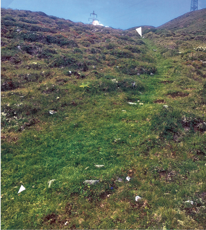
Abb. 113: Stuben–Pfunds (A) (Stelle 14.2). Zadresjoch, Ost-Seite (ca. 2320 m ü. M.). Wegspuren des prähistorischen und frühmittelalterlichen Weges, südlich vom Bach. Blick nach Westen.