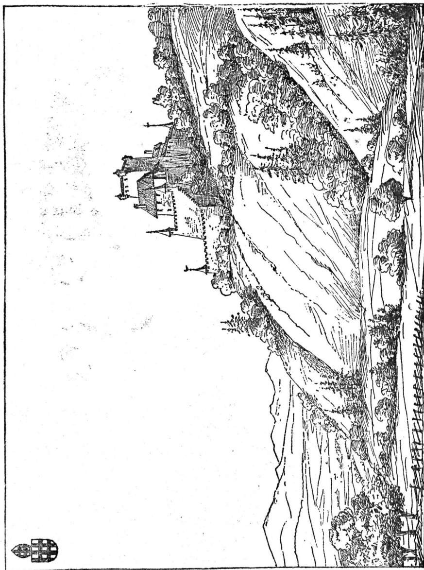
Fig. 373. — LE CHATEAU DE SIGNAU (Berne)