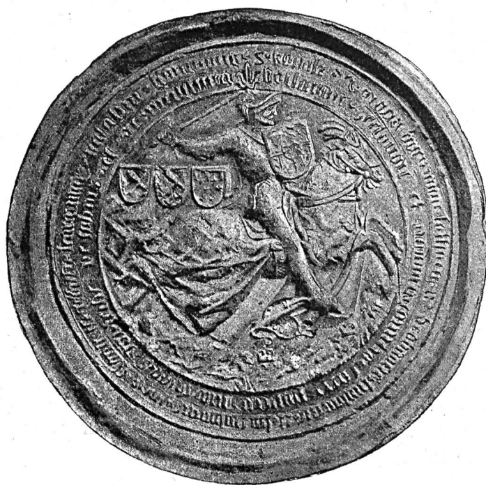
Fig. 475. Sceau de Charles-le-Téméraire, duc de Bourgogne. 1468.

Les figures qui ornent cet ouvrage ont toutes été exécutées d'après les empreintes originales ou les empreintes surmoulées ; le nouveau procédé employé pour ces reproductions, participant à la fois de la photographie, de la gravure et de la typographie, achève de leur donner toute la fidélité désirable. Il est arrivé à rendre avec une précision mathématique les moindres reliefs des empreintes de cire ou de métal, et aussi leurs moindres défauts ; mais nul ne s'y trompera et ne lui imputera les injures que le temps a fait subir à ces fragiles monuments. Nos lecteurs pourront du reste juger de ce que valent les figures par le spécimen ci-dessous, représentant le sceau de Charles-le-Téméraire :