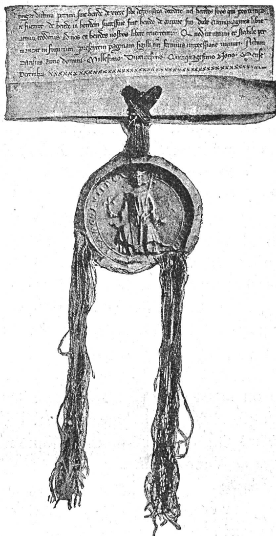
Fig. 478. Sceau pendant (1259).

Au XIII e siècle, les goûts artistiques s'étant partout développés, les tissus de soie aux brillantes couleurs, aux broderies élégantes, sont adoptés par les chancelleries des hauts et puissants personnages. Naturellement, ces lacs de soie revêtent la couleur de la livrée de ceux qui les employaient. Voici un spécimen de sceau appendu à une charte de Saint-Louis, en 1259 :