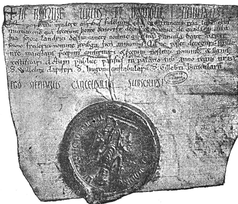
Fig. 476. Exemple de sceau plaqué.

Mais, à mesure que les empreintes devinrent plus épaisses, il fallut nécessairement un autre moyen de fixer les sceaux aux chartes; on imagina les sceaux pendants , c'est-à-dire les sceaux appendus au bas des pièces à l'aide d'un lien, tenant à la cire par un bout et au parchemin par l'autre. L'attache la plus usitée, surtout pour les chartes ordinaires, a été la « queue de parchemin »; la « simple queue » n'est autre chose qu'une découpeure taillée dans la charte elle-même, en forme de lanière et supportant à son extrémité le sceau pendant :