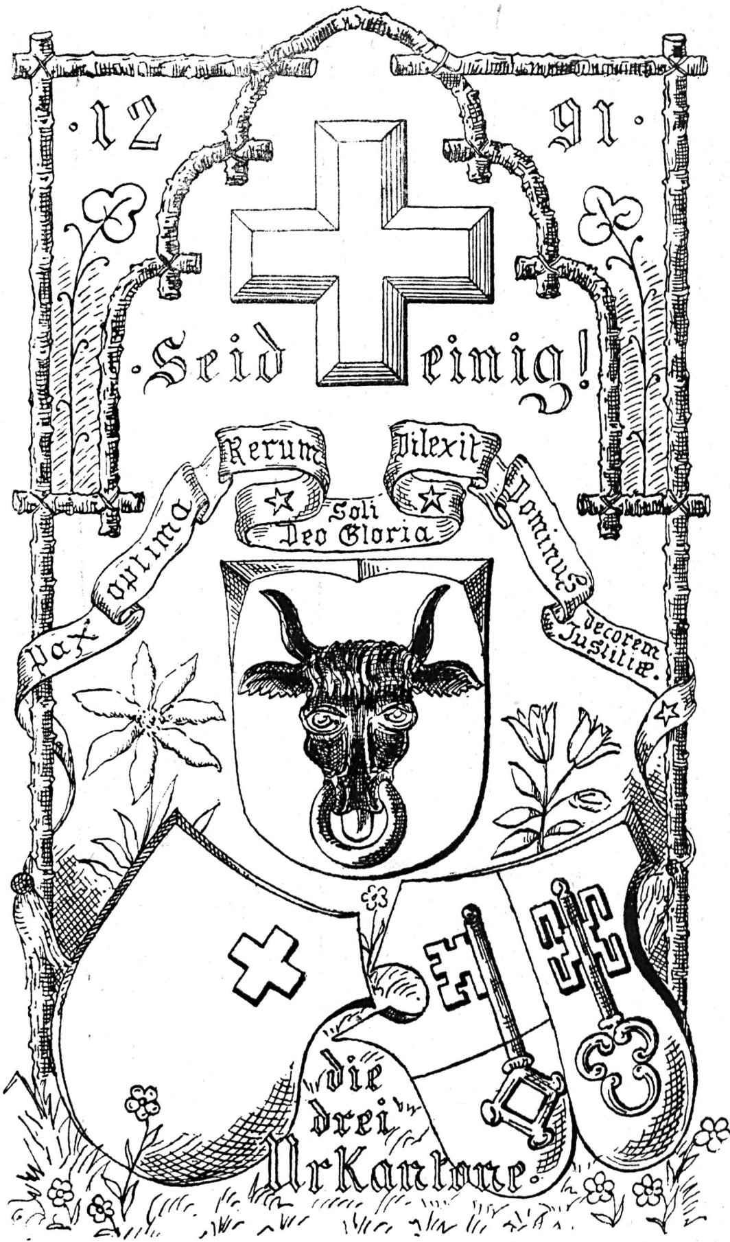
Fig. 484. Calendrier suisse.