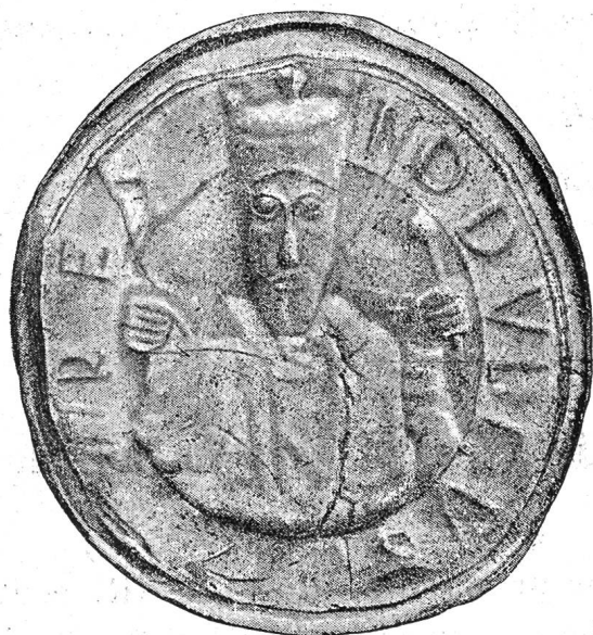
Sceau de Rodolphe III, roi de Bourgogne.

de Saint-Maurice ; c'est probablement d'après ce dernier que M. le D r Morel a pu relever l'empreinte qui nous a permis de reproduire ce sceau intéressant d'une façon plus exacte au moyen de l'autotypie.