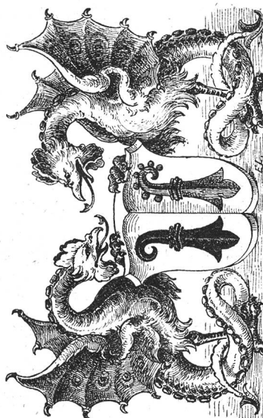
Armes de Bâle.