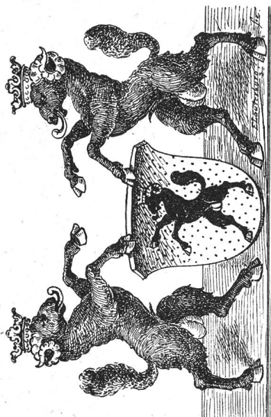
Armes de Schaffhouse.