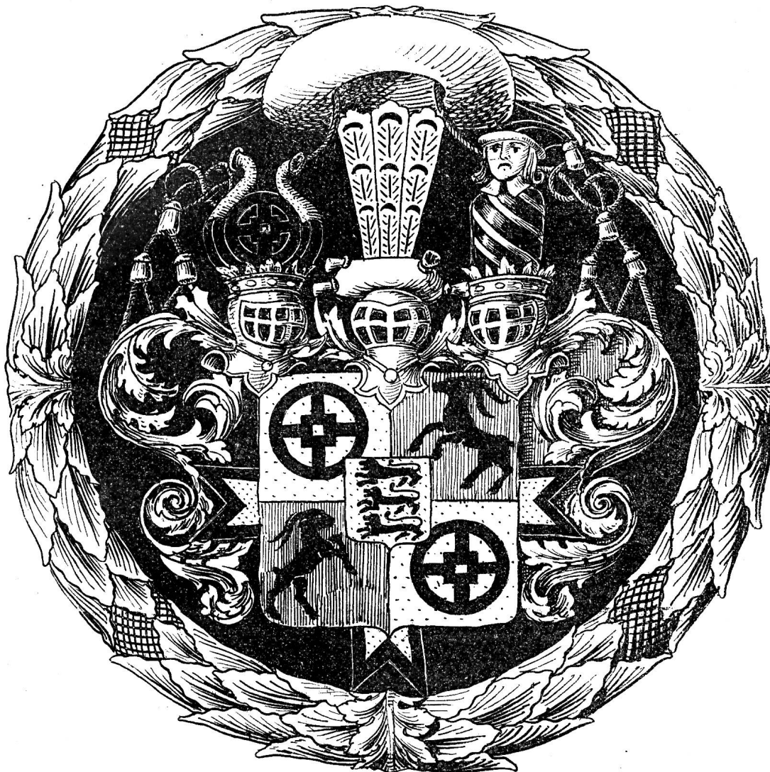
Probst-Peyer im Hof, zu Luzern. 1691-1709.