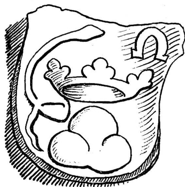
Ecke Greifengasse unt: Rebengasse.