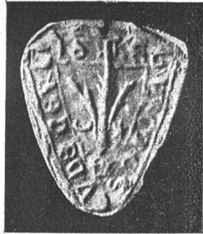
Siegel von Erlach.

Ein Fragment dieses ersten Siegels von Erlach hängt nun an einer Urkunde des Stadtarchivs Neuenstadt, deren Doppel (der Stadt Erlach gehörend) für den Abdruck in Bd. VII, p. 345 der Fontes R. B. gedient hat. Das Stück ist datiert vom Mai 1348. Einen vollständigen Abdruck vom nämlichen Stempel