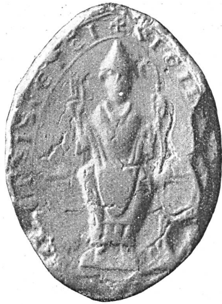
Fig. 19. Siegel des Hugo von Hasenburg, Bischof von Basel.

Für diese Zeit stehen uns nun zwei Bischöfe des Namens H. zur Verfügung, nämlich Hugo von Hasenburg, der 1176 und 1177 den Bischofsitz inne hatte und Heinrich von Horburg, der von 1180 bis 1189 als Bischof vorkommt. Trouillat entschied sich für den zweiten und setzte die Urkunde ins Jahr 1181 (vgl. Monuments de l'histoire de l'ancien évêché de Bâle , Bd. II p. 22). Da aber Heinrich von Horburg ein anderes Siegel führte, wie uns die Abbildung dieses im Basler Urkundenbuch (Bd. I, Siegeltafel I, No. 1) beweist, so ist man wohl gezwungen, das uns vorliegende Siegel dem Hugo von Hasenburg zuzuschreiben.