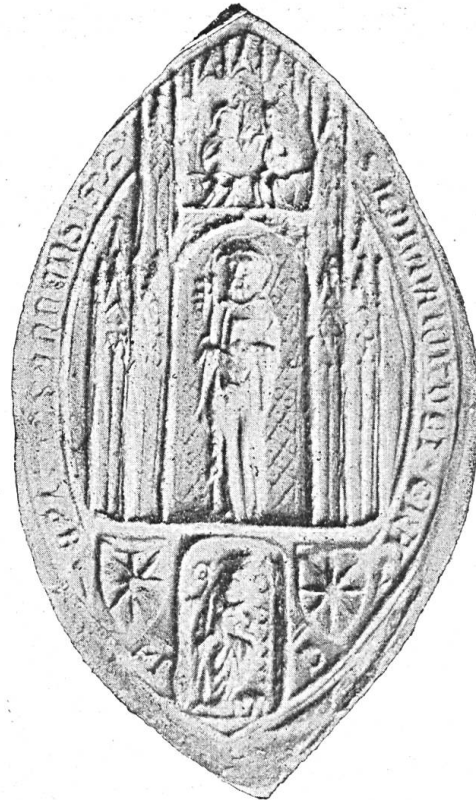
Fig. 22. Siegel des Bischofs Adhémar Fabri v. Genf.

Mayors Werk verdient bei allen Freunden von Geschichte, Kunst und Heraldik wärmste Empfehlung.