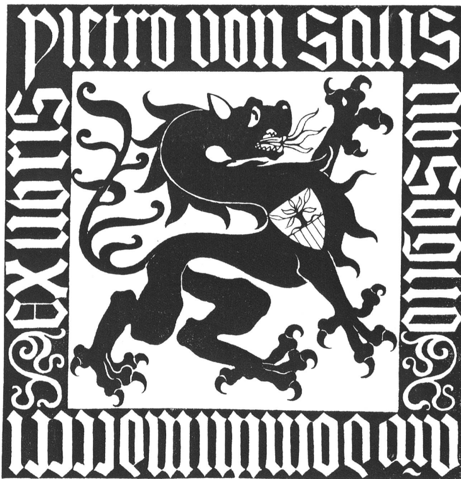
Bibliothekzeichen gez. von P. v. Salis-Soglio (Zürich).