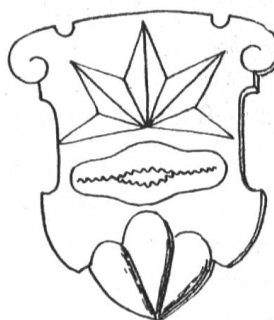
Fig. 34 Gebäck Bülach 1673

Die hier in Abbildungen vorliegenden Proben zeigen uns eine Anzahl typischer Wappen kleiner Leute; sie könnten um Hunderte vermehrt werden und zwar aus dem Denkmälerschatz von Stadt und Land, Berg und Tal. Die Gegenstände, die als Schildbilder verwendet worden sind, zeigen, dass kein Erzeugnis dem alten Schweizer zu prosaisch erschien, um sein Eigentum zu kennzeichnen; vom Brot, Wecken, Bretzel 1 , reicht die Stufenleiter bis zur Wurst, die sich in einem Schild von 1692 zu Flühen bei Mariastein ausgehauen findet.