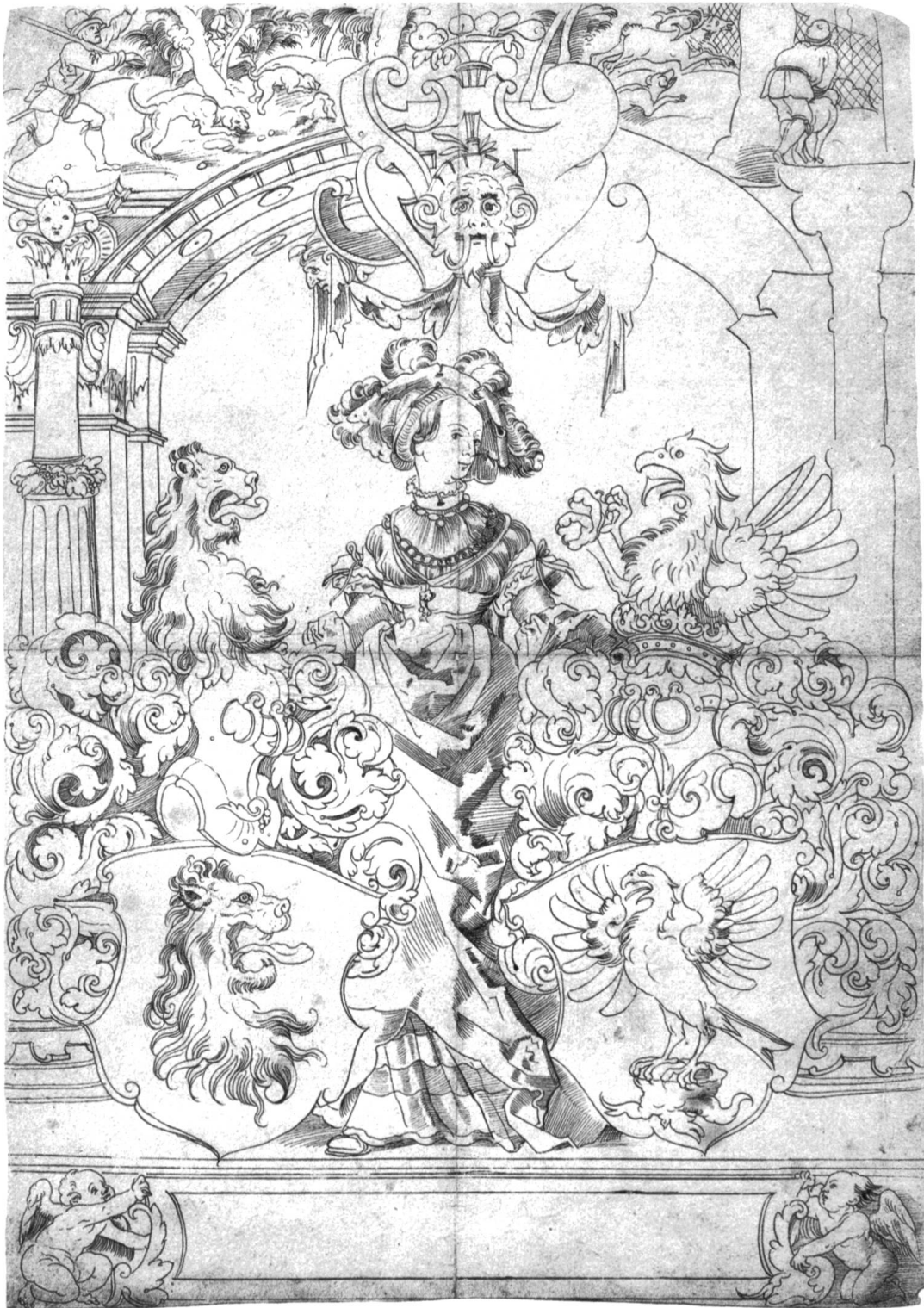
Allianzwappen Im Thurn - Stockar. Scheibenriss von Tob. Stimmer (Smlg. E. Stückelberg †).