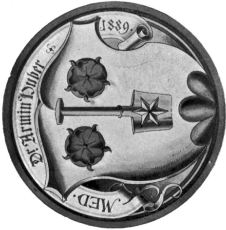
Scheibenrisse von R. Wäber