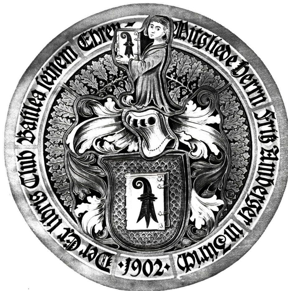
Wappen des Ex libris Club „Basilea“ nach einer Scheibe von Emil Gerster, Glasmaler in Basel.