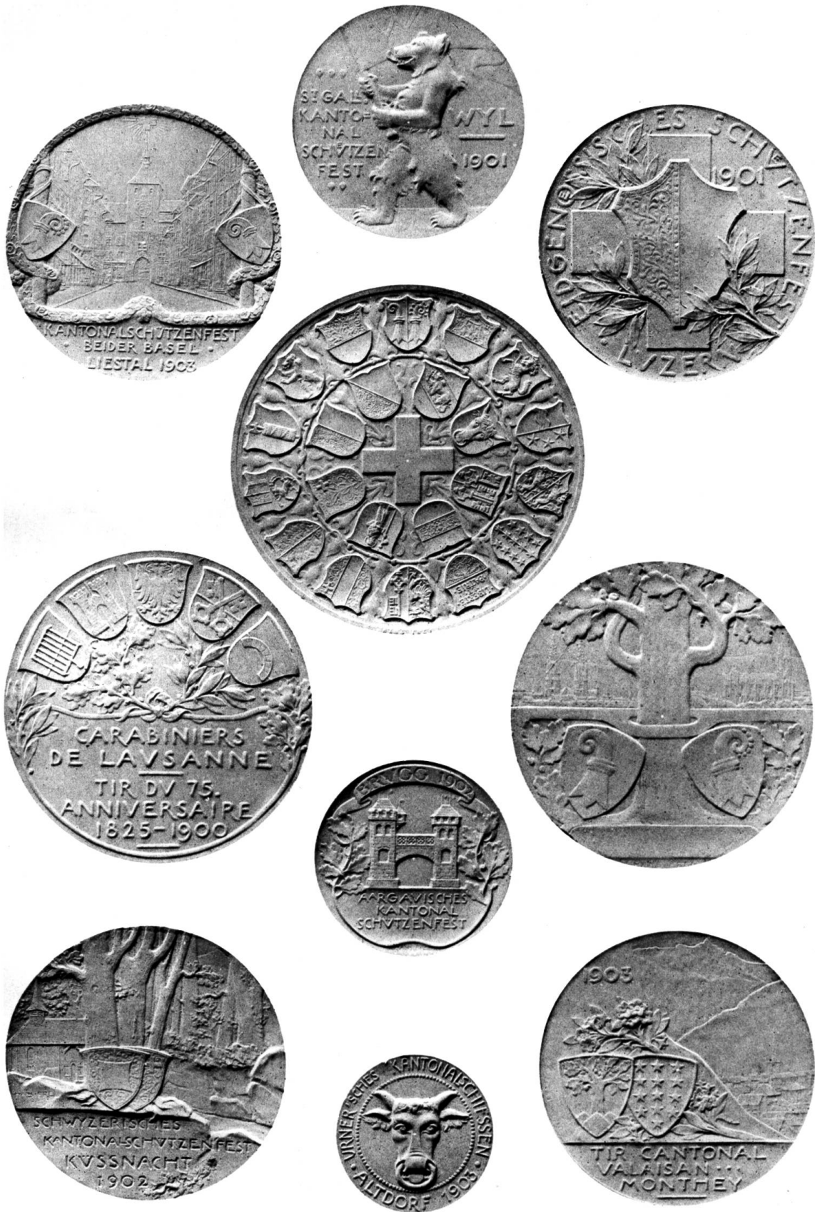
Heraldische Medaillenreverse von Hans Frei in Basel.