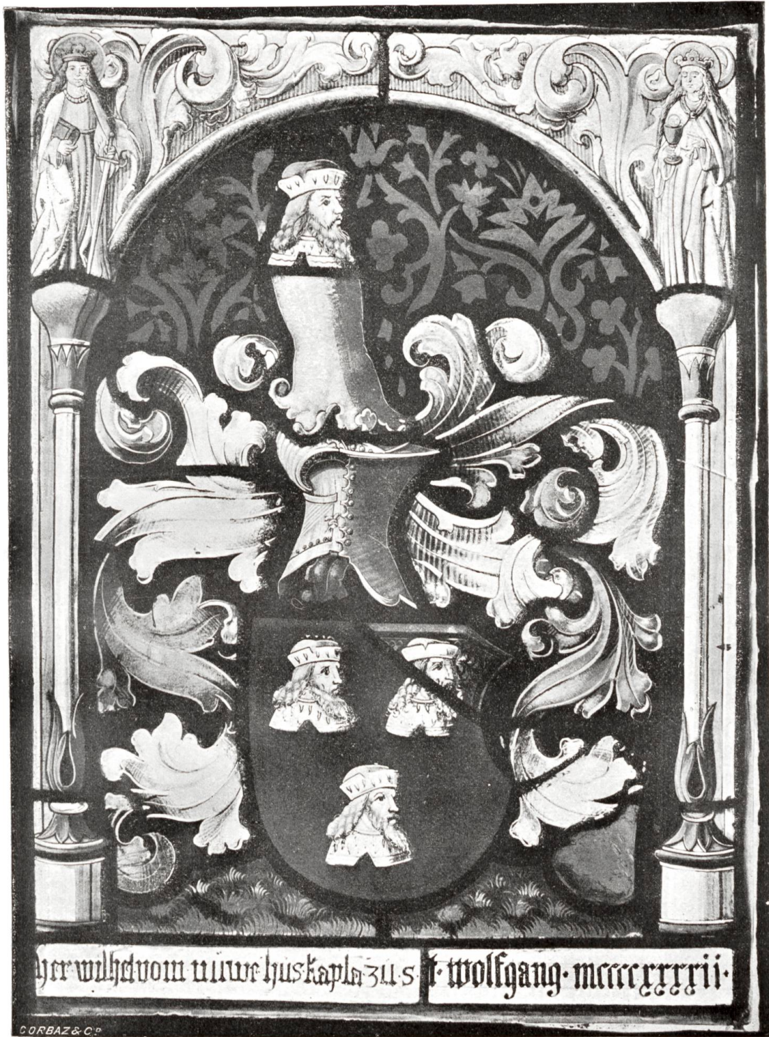
Vitrail aux armes de Petermann de Faucigny (Musée cantonal de Fribourg)