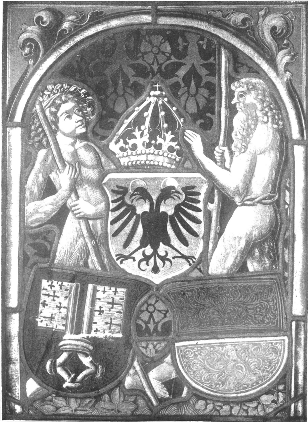
Unterwaldner Scheibe mit dem Wappen beider Landesteile, ca. 1505.

Schweiz. Landesmuseum, aus der Sammlung Martin Usteris, vielleicht ursprünglich im Rathaus zu Baden.