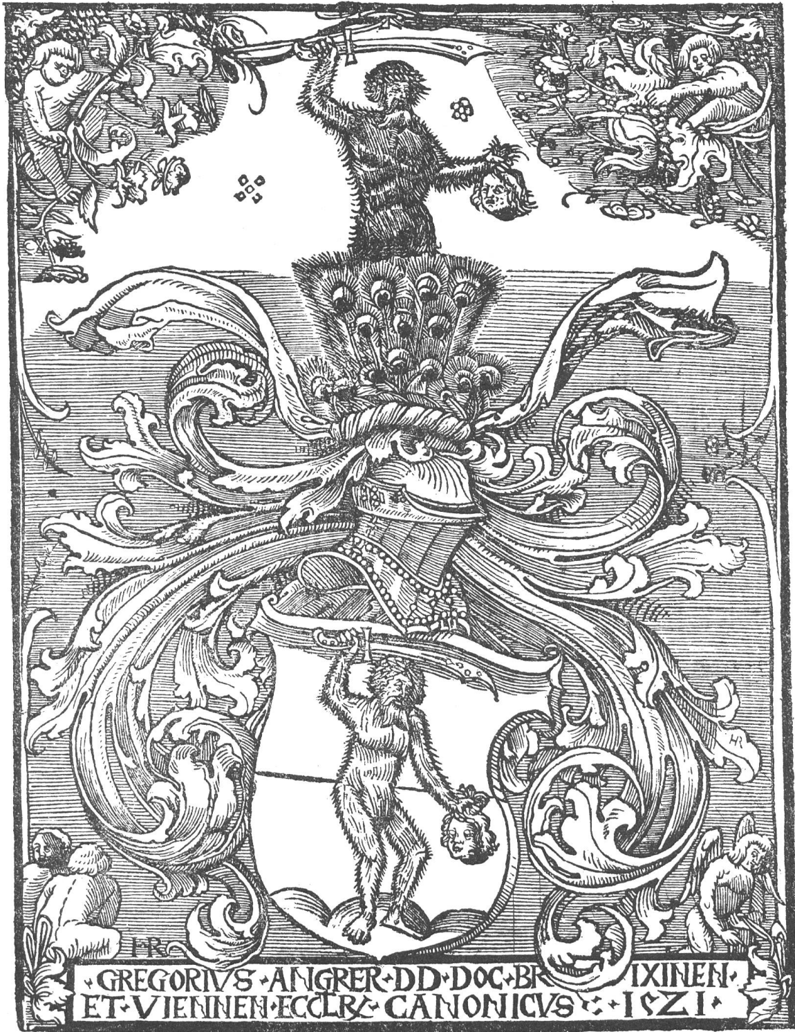
Ex-libris des Canonicus Angrer aus Brixen.