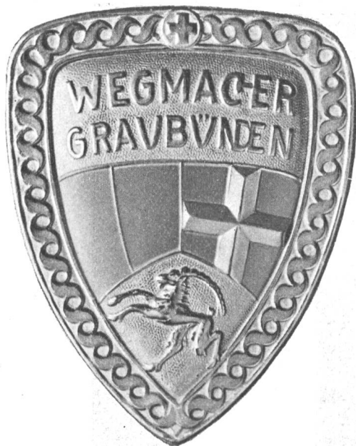
Fig. 6 Vereinfachtes Bündnerwappen in den bündnerischen Wegmacherschilden.

auf die heraldisch ganz unmögliche und unverständliche Zusammenstellung, wie sie durch Beschlüsse des Kleinen und Grossen Rates anno 1803 offiziell geschaffen wurde.