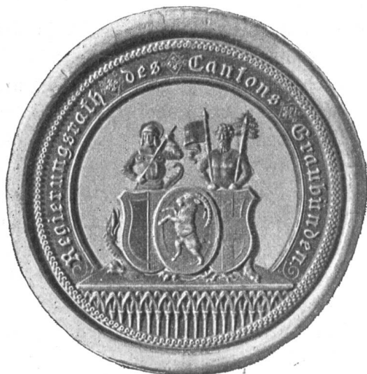
Fig. 1 Altes Regierungsrats-Siegel des Kantons Graubünden (nach 1803).

Vor 18 Jahren habe ich in meiner „Entwicklungsgeschichte des Bündnerwappens“ 1 hingewiesen auf alte Drucke und Fassadenmalereien und dabei betont, daß fast ausnahmslos die drei Schilde ohne Schildhalter einfach neben-