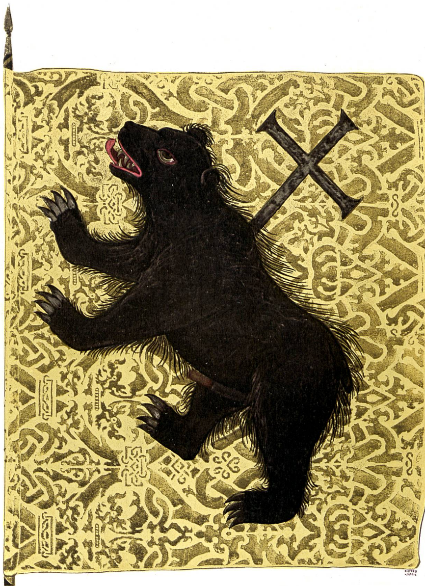
Juliusbanner der Talschaft Ursern 1512.

Schweizer. Archiv f. Heraldik 1911, Heft 3, S. 140.