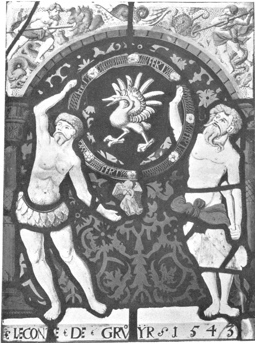
Vitrail aux armes de Jean de Gruyère Chevalier de l'Annonciade (Musée de Fribourg)