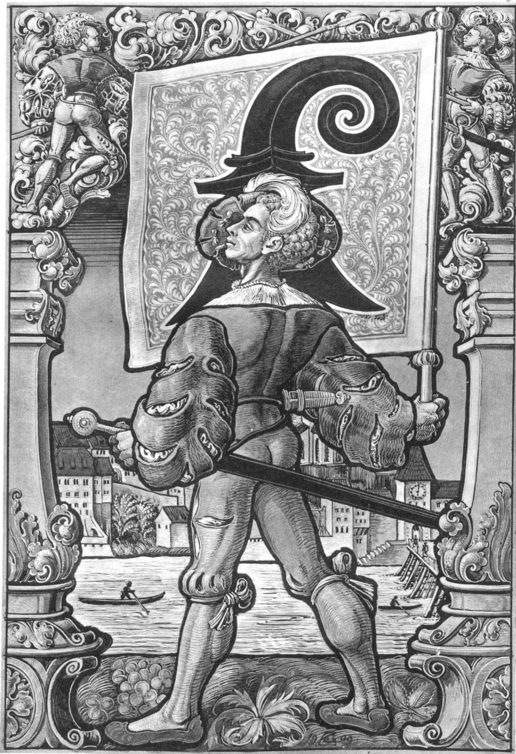
Basler Standesscheibe, entworfen und ausgeführt von Emil Gerster, Glasmaler in Basel.