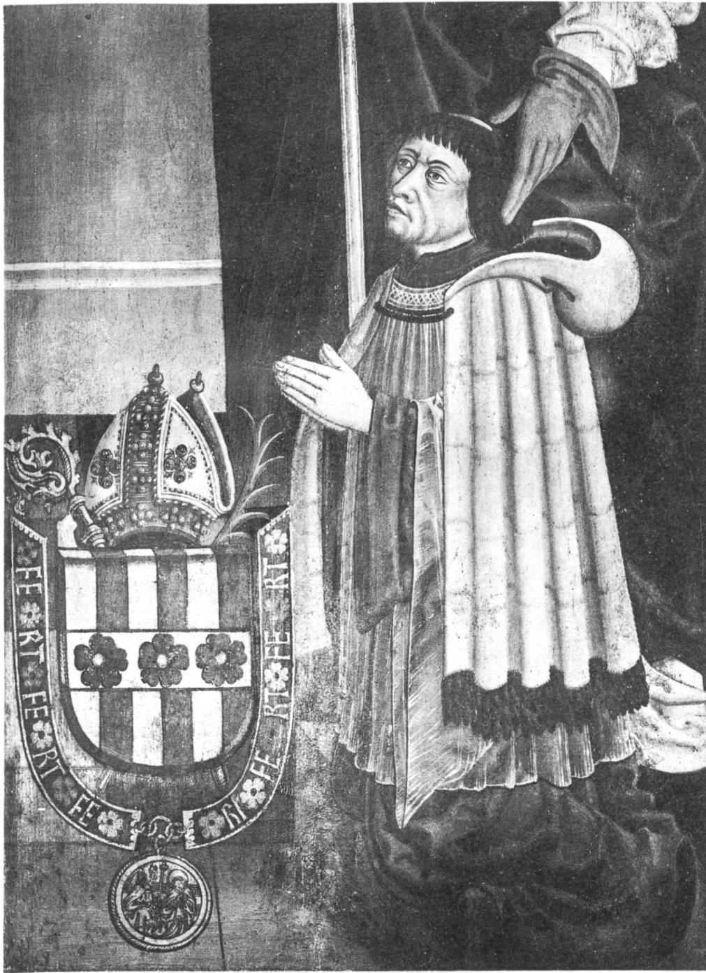
Claude d'Estavayer Premier Chancelier de l'Ordre de l'Annonciade.

Archives hérald. suisses 1911. Fasc. IV, page 184.