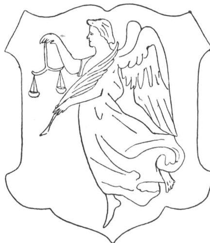
Fig. 140 Wappen von Gerzensee (Relief auf der Glocke).