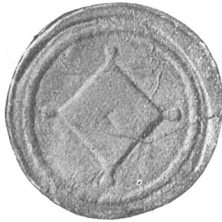
Fig. 23 Siegel der Landschaft Küsnach. 1732.