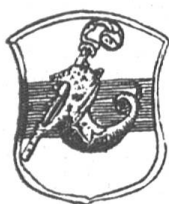
Fig. 28 Armoiries de l'Ajoie d'après un armorial du XVIII e siècle.

Il existe peu d'anciens documents représentant ces armoiries. Nous les reproduisons ici d'après un armorial manuscrit du XVIII e siècle des archives de Delémont (fig. 28).