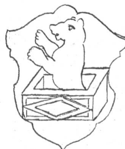
Fig. 101 Wappen von Trogen nach der Wappenscheibe von 1628.

Etwa der gleichen Zeit wie obgenannte Wappenscheibe entspricht ein sauber gestochenes Wappenrundsiegel der Gemeinde Trogen mit der Umschrift: Sig. communitatis Trogensis. Das Innere mit dem Wappen lässt unten nur wenig vom flotten Bären in dem Troge, letztern aber im Schildrand verschwinden. Es ist eine etwas eigentümliche Beobachtung zu machen. Während dem Bären oft genügend Beobachtung in der künstlerischen Behandlung zuteil wird, macht es oft den Anschein, als ob dem Troge selten eine leidliche Aufmerksamkeit geschenkt würde. Um den Trog, da drückt man sich herum. Es mag dies in der Ungewissheit liegen, als was denn dieser Trog eigentlich anzusprechen sei. Man hat es da nicht mit einem Wasser-, geschweige denn mit einem Backtrog zu tun. Es berechtigt vielmehr die Annahme, es sei mit diesem redenden