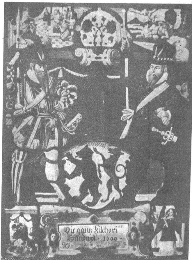
Fig. 93 Wappenscheibe mit dem Wappen Hundwil im Gemeinderatszimmer in Hundwil.

Bis auf 1755 herab lassen sich weiter keine Spuren von einem Gemeindesiegel nachweisen und erst in genanntem Jahre entsteht wieder ein solches. Auf die Frage, wer denn früher gesiegelt habe, lässt sich eine Antwort geben, die so ziemlich alle Gemeinden angeht. In Ermangelung eines eigenen Insiegels wurde jeweils das Landessiegel, das Privatsiegel des jeweiligen