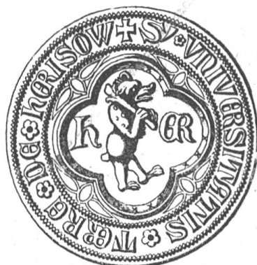
Fig. 94 Siegel von Herisau.

Herisau leitet seinen Namen von der Au eines Herin ab. Es tritt 837 als Herinisauva in die Geschichte ein. Der Kirche wird schon 907 gedacht; sie ist somit die älteste im Appenzellerlande. Über Herisau als einer Vogtei, setzten die Edeln von Rorschach ihren Ammann. In den Kriegen der Abtei St. Gallen wurde Herisau zum wiederholten Male ein Opfer der Flammen, so auch 1403. Durch das Bündnis vom 17. Januar 1401 traten die Herisauer in nähere Verbindung mit den Appenzellern, wurden aber vom Abte wieder davon abwendig gemacht. Herisau hat sich aber nachher um so inniger wieder Appenzell angeschlossen. 1529 fand die Reformation ihren Eingang in Herisau; seit der Landteilung 1597 ist Herisau neben Trogen ein Hauptort.