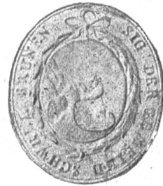
Fig. 96 Siegel von Schwellbrunn.

Mit dem Zehnten von „Schwellbrunn“ belehnt der Abt von St. Gallen unter anderm seinen Meier Ulrich Küchenmeister zu Hundwil am 2. Juni 1268. Später wird Schwellbrunn zu Herisau gerechnet bis 1648; es gründet sich eine eigene Gemeinde. 1794 schaffte sich diese ein eigenes Siegel an. Die Bedeutung des Siegelbildes tritt klar zutage durch den „schwellenden Brunnen“, der aus dem Felsen quillt.