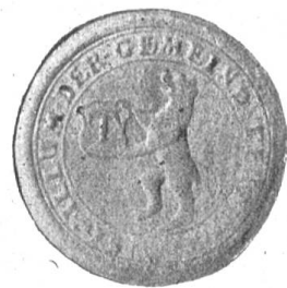
Fig. 97 Siegel von Teufen.

An den beiden Bündnisbriefen der Stadt St. Gallen mit Appenzell vom 17. Januar 1401 hängt kein Siegel von Teufen. Letzteres hat sich wie Gais und Urnäsch unter das Siegel von Appenzell gebunden. Erst Ende des 16. Jahrhunderts oder anfangs des folgenden scheint ein Bedürfnis nach einem Gemeindesiegel empfunden worden zu sein. Solches nun ist ein Rundsiegel mit der Umschrift: „Sigillum der Gemeind Teufen“. Innert dieser wird ein Schild im Renaissancestil von einem aufrechtstehenden Bären mit den Vordertatzen hochgehalten. Der Buchstabe T allein ist es, was diesen Schild schmückt; spätere Abbildungen zeigen diesen schwarz auf blauem Grunde. Da nach dem heraldischen Gesetze schwarz auf blau als Farben niemals aufeinander vorkommen sollen, muss da eines der zwei sogenannten Metalle, Gold oder Silber, in Betracht kommen. Aus bestimmten Gründen wurde Gold vorgezogen. Wenn nun das Wappen der Gemeinde Teufen in der obern Schild-